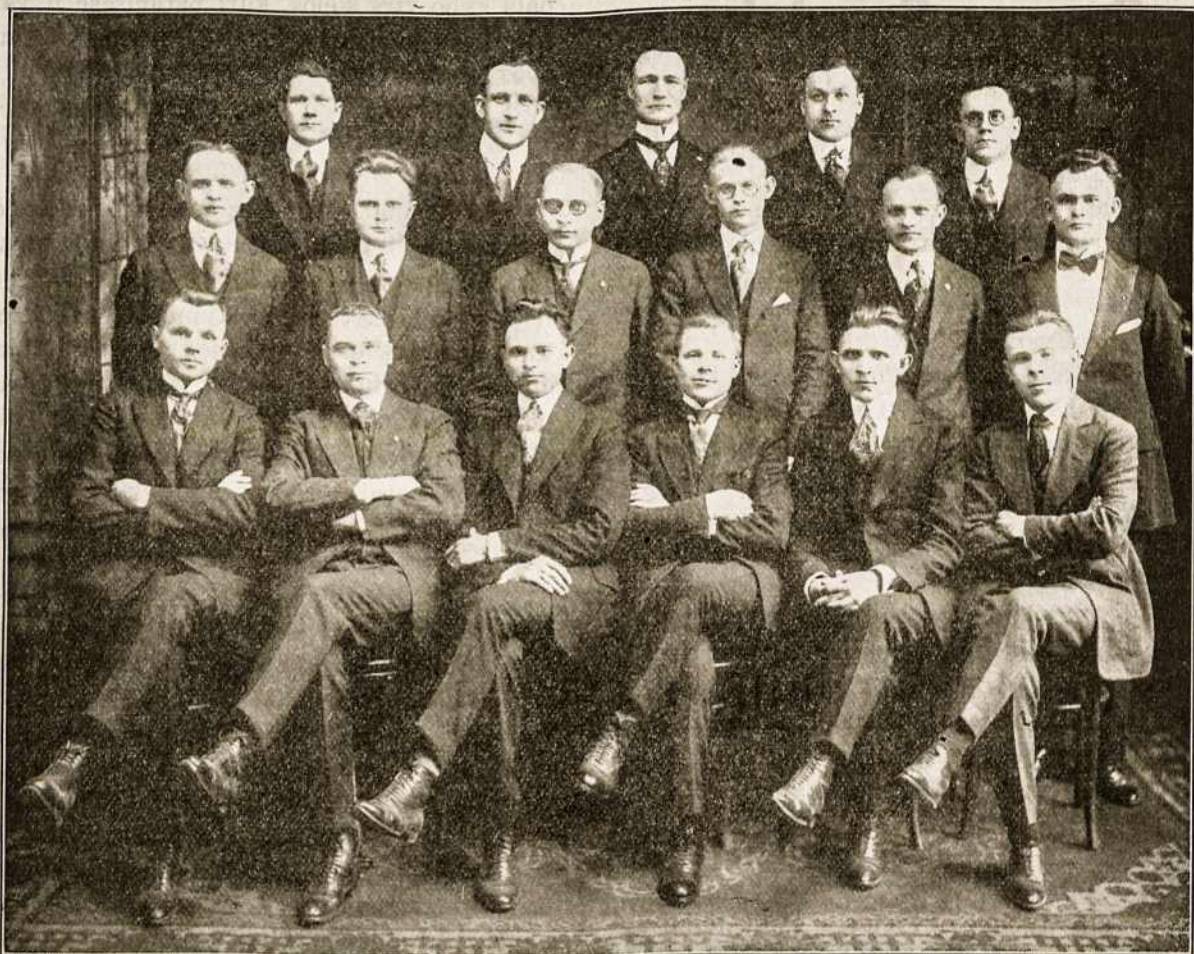
Brooklyno Lietuvos Vyčių 41-mos kuopos vaikinai pasirengę netrukus iškelti Lietuvon. Ši jaunimo būrelį daugiausia reprezentuoja suvalkiečiai, bet jų tarpe yra taipgi kauniškių ir vilniškių. Visų didžiausiu troškimu yra kogerčiausia grįžti į tėvynę ir darbuotis jos naudai Lietuvoje.

Viešpats nužengė į šį pasaulio šitą apgail- lestaujamą nesutinkančių draugijų šeimą sutverti?