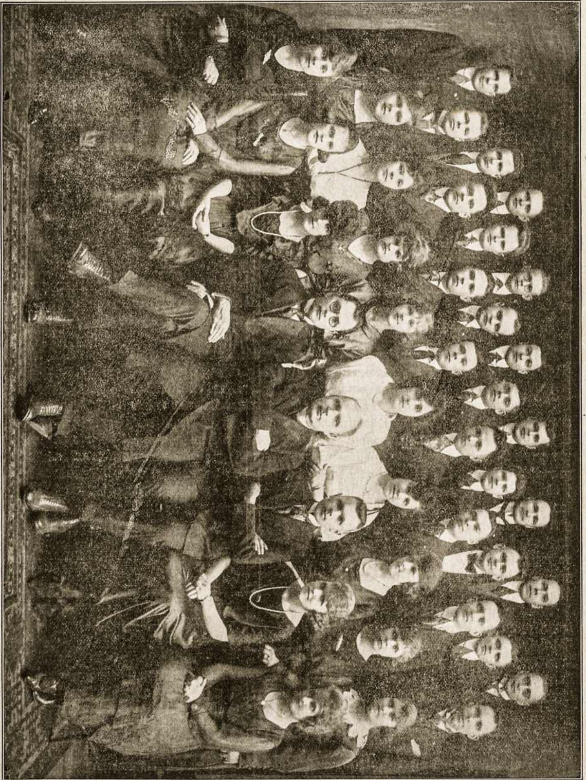
L. Vytis 41-ma kuopa Brooklyn, N. Y. Ši kuopa yra daug pasidaravusi Lietuvai ir daug jos narių rengiasi grįžti Tėvynei — Lietuvon.