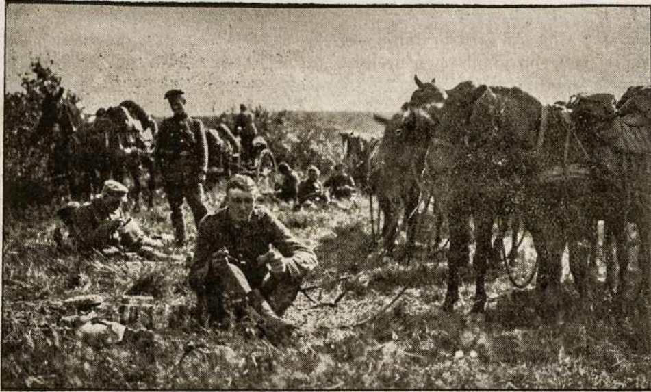
Mūsų artilersitai bolševikų fronte. Eroliai kareivėliai, draugai žirgužėliai...

Mikas. Kas nauja? Tuojaus draugai. Da tokių naujienų lietuvių laikraščiai nepranešė. ( Visi sustoja aplink ). Draugės ir draugai! ( Scenos gilumoje augštumoje )