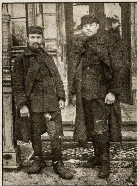
Lietuvos kareiviai pabėgę iš lenkų belaisvės. Išžiūrėk į jų drabužius, atspėsi likimą lenkų belaisvėje.

Bet, dabar aš ją myliu, Jos laukus, miškus ir pievas! Apie praeitį tyliu... Teužmoka tau tik Dievas!