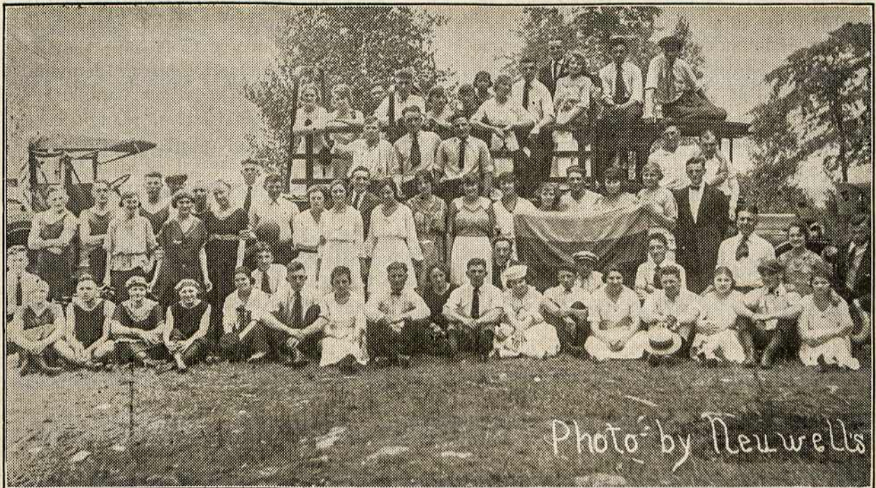
Plymouth'o, Kingston'o ir Wanamie, Pa. Vyčių išvažiavimas, kuriame dalyvavo virš 400 jaunimo. Išvažiavimas įvyko Lily Lake.