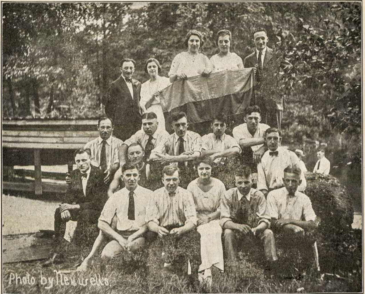
Lietuvos Vyčių 101 kuopos, Plymouth, Pa., 32 kuopos, Kingston, Pa. ir 68 kuopos Wanamie, Pa. valdybos: