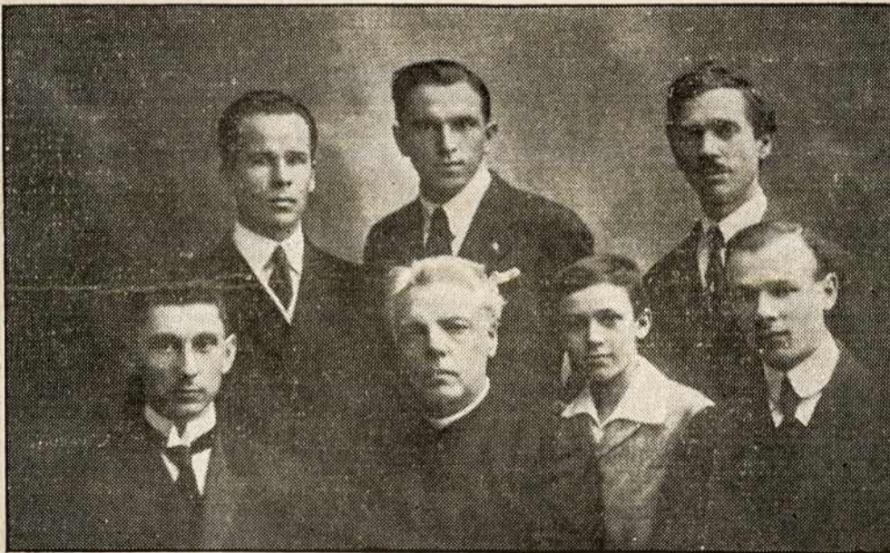
Lietuvių inteligentų būrelis Romoje, Italijoje.

ga suvirpėjo. Ilgu jai pasidarė, neramu. Prisiminė Matas ir skaudus jos žodžiai, kuriais jį save nuo Mato atskyrė gal ant visados. Iš akių Marytės pasiliejo ašarėlių upečiai. Ramino tėvas dūkrele, bandė pakiusius jausmus nutildyti juokais, bet niekas negelbėjo. Marytei atsivėrė akis ir jinai pajuto padariusi didelę skriaudą sau, Matui ir savo tėvynei Lietuvai, iš kurios taip negražiai pasijuokė.