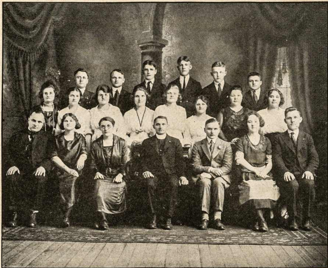
Lietuvos Vyčių 20-ta kp., Šv. Kazimiero parap. Nashua, N. H.

karą kiekvienas norėjo gilesniais bruožais įsirašyti savo atminties knygon. Tad, nors ir vėlus jau buvo metas, nors ir suvargę labai pergyventais rūpeščiais ir darbu, nors daug gal buvo nedasakytų minčių, daug užmanymų išblaškyta, bet miegas nevargino blakstienų.