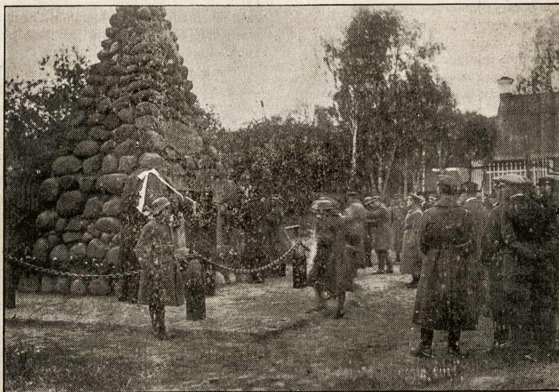
Paminklas žuvusiems dėl Lietuvos laisvės ir nepriklausomybės, atidengtas Kaune spalio 16 d., 1921 m.