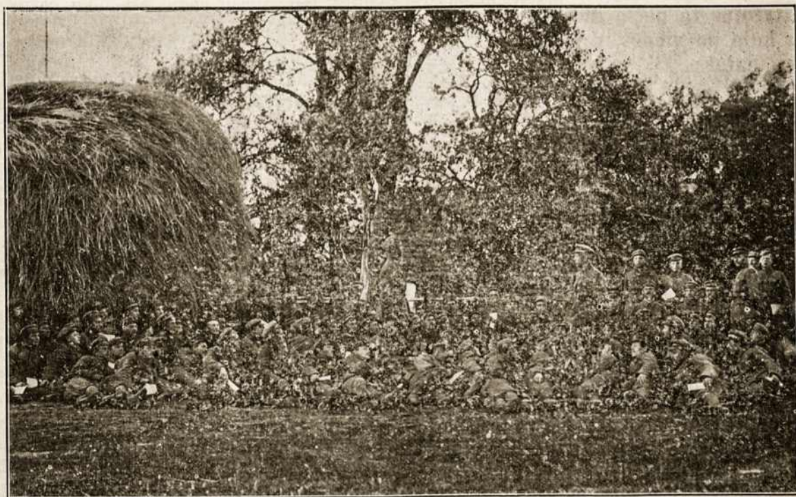
Lietuvos kariuomenė. N. N. pėst. pulko mokimas vasaros metu. Kariškiai klauso vado pamokų.

Mes-gi, jaunime, stengkimės tą paliūdyti darbais, elgimosi, išsilavinimu! Švieskime liaudžiai išmintingumu, pasišventimu, kad ji galėtų mumis pasitikėti!