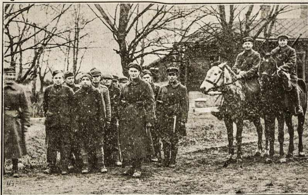
Lietuvos kariuomenė. Želigovskio (lenkai) be laisviai. Ėjo mūsų pavergti, patys pateko į nelaisvę. Jų išvaizda žulikauskiška, ne kariška.

ri jas užgrobti. Sutrupėjo Rusijos galybė, sutrupėjo Vokietijos, gal greit sutrupės ir mažytė, sulyginus su anomis, Lenkija.