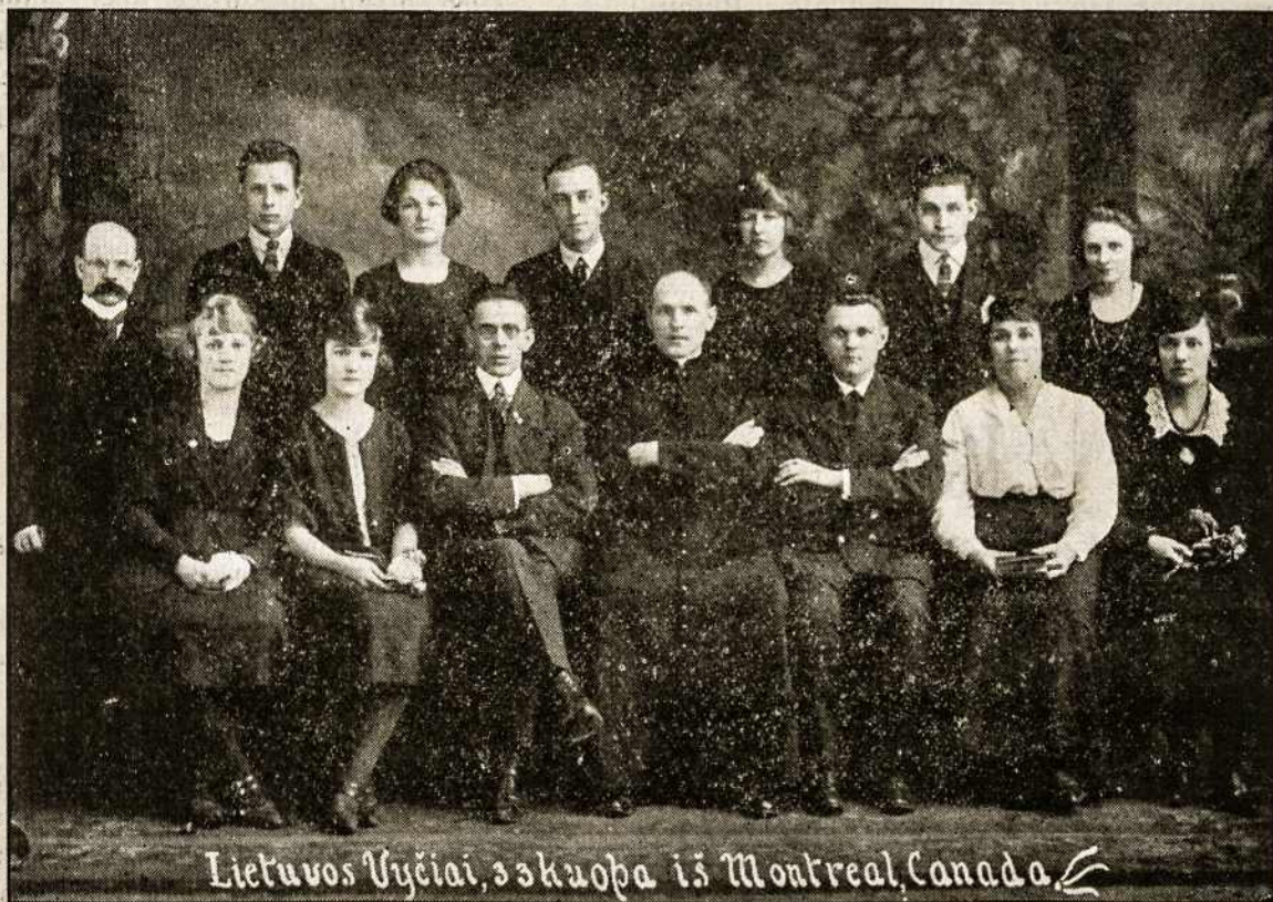
Lietuvos Vyčiai, 3 skuopa iš Montreal, Canada

šypsodamosi sako: “Ar aš negraži, ar manęs nemyli?” Kita prie šalies sujuda, užslepia ją ir tuoj saldus aromato kvapsnis pripildo krūtine.