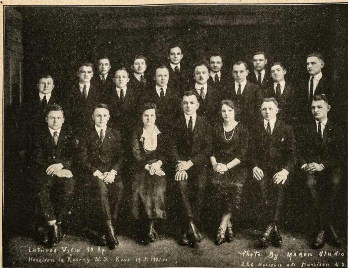
Lietuvos Vyčių 90 Kp. Harrison ir Kearney N. J. Kovo 19 d. 1921 m.