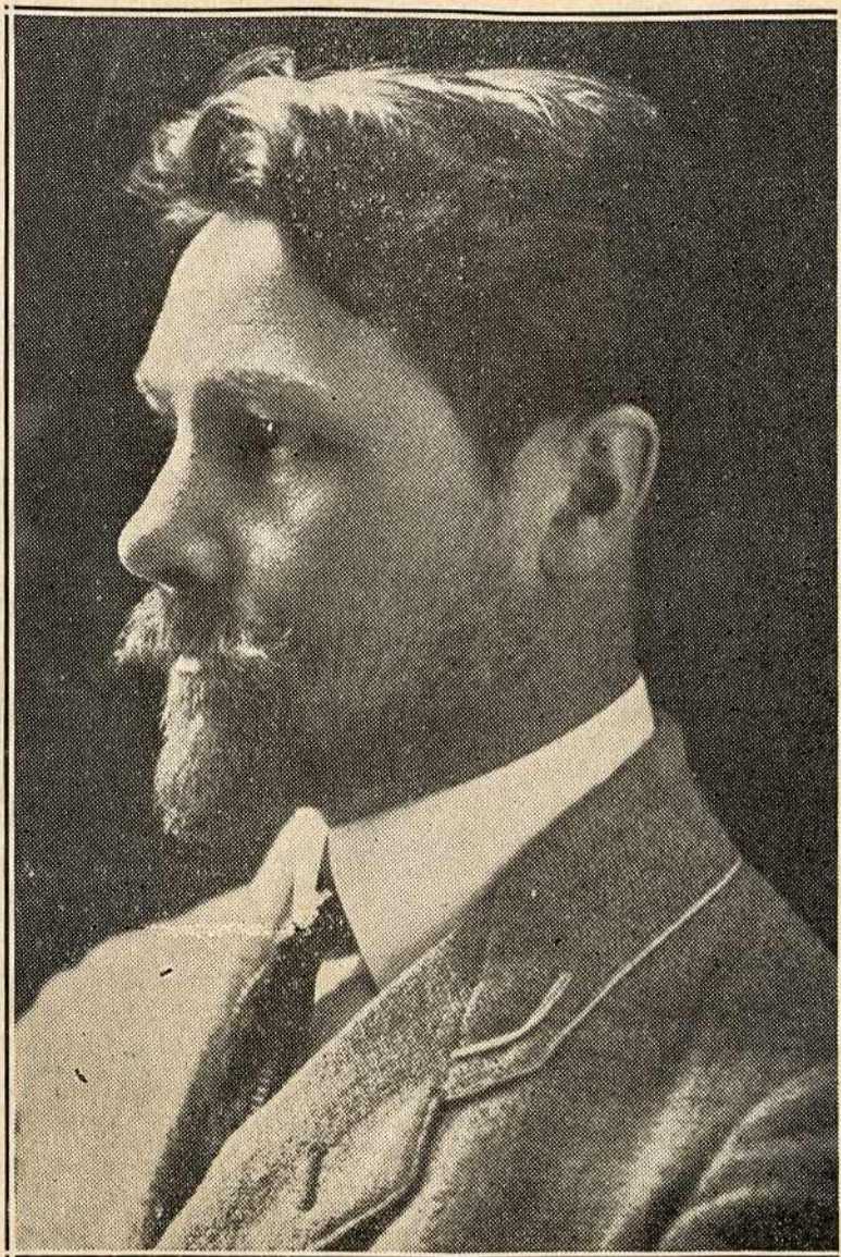
Dailininkas A. Žmuidzinavičius-Žemaitis.

Antanas Žmuidzinavičius gimė Seirijų miestely, Seinų apskrity. Studijavo dailę Varšavoje, Paryžiuje, Munchene, Florencijoje, Petrapily ir kit. Atgavus lietuviams spaudą persikėlė į Vilnių, kur su ail. M. Čiurlioniu ir P. Rimša įsteigė Lietuvių Dailės Draugiją ir kaip tos draugijos pirmininkas darbovosi ten iki pat didžiojo karo.