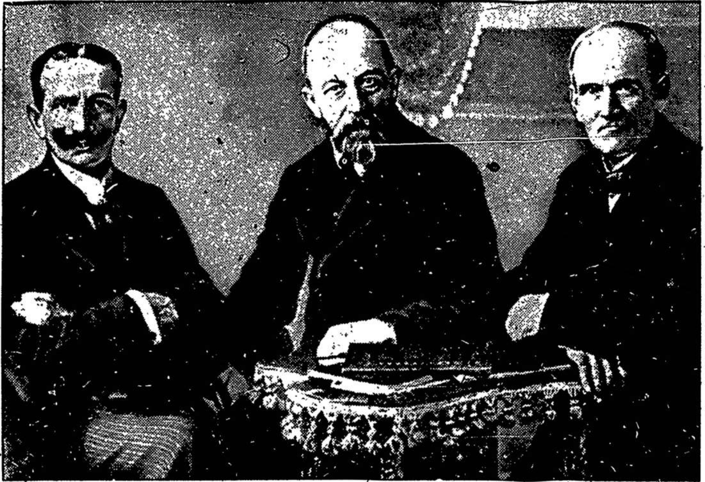
Klaipėdos Lietuvių Vadai.