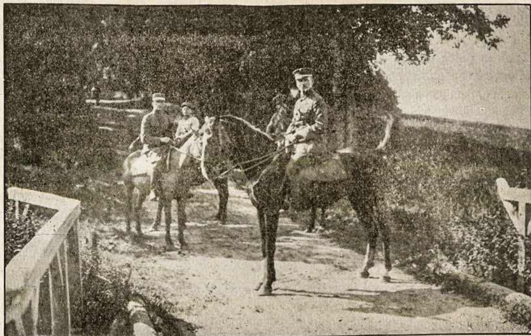
GENEROLAS SILVESTRAS ŽUKAUSKAS, Vyriausias Lietuvos kariuomenės vadas, kuriam Vyčiai yra sumanę Aukso Karda.