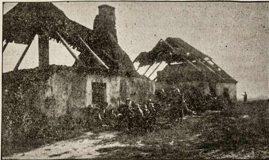
Štai, ką paliko vokiečiai ir bolševikai išeidami iš Lietuvos!