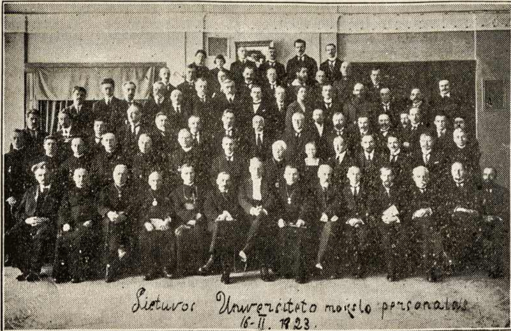
LIETUVOS UNIVERSITETO PROFESORIAI 16—II—1923 M. Dabar profesorių personalas yra žymiai padidėjęs.