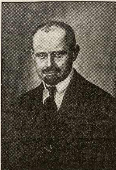
ALEKS. STULGINSKIS, Lietuvos Prezidentas.