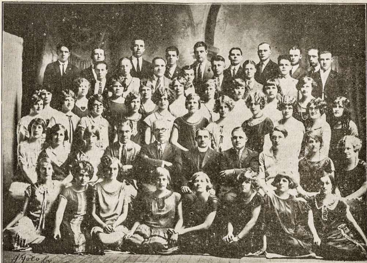
L. VYČIŲ 20 kp. IR ŠV. KAZIMIERO CHORAS, NASHUA, N. H.