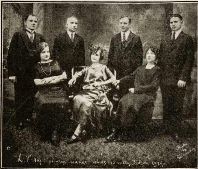
L. VYČIŲ 4-tos KP. PIONIERIAI,

išbuve 10 metų nuolatiniams kuopos nariams. Jų pagerbimui kuopa surengė vakarą, kuris įvyko š. m. balandžio 27 d. Kuopa įteikė visiems po aukso žiedą atminčiai.