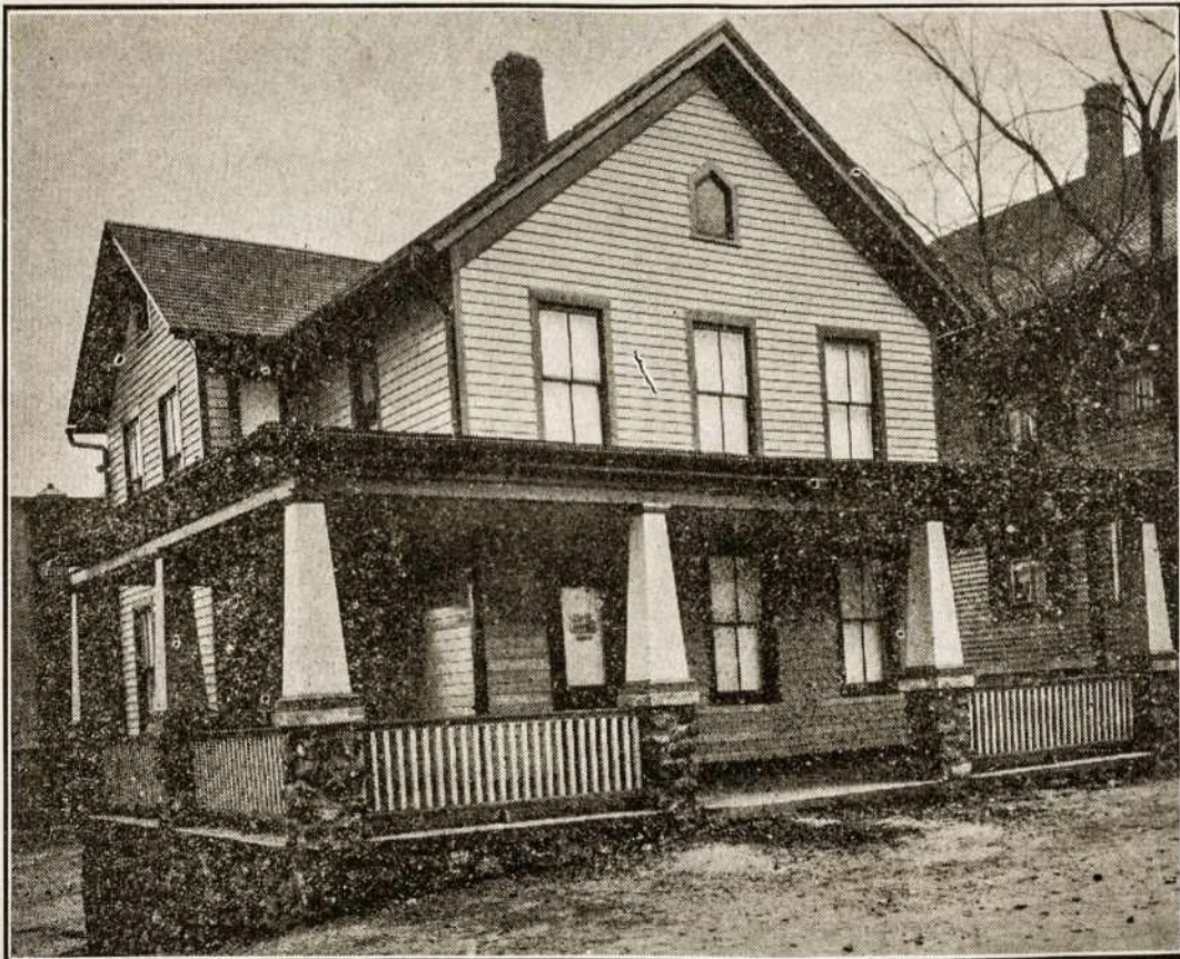
LIETUVOS VYČIŲ 7 KP. (WATERBURY, CONN.) NAMAS, isteigtas rūpesniu dvasios vado gerb. kun. J. Valantiejaus. Čia yra moderniai įrengtas klūbas, kuriame Waterburio jaunimas laiko susirinkimus, linksmam bei pavyzdingam praleidžia savo liuoslaikį.