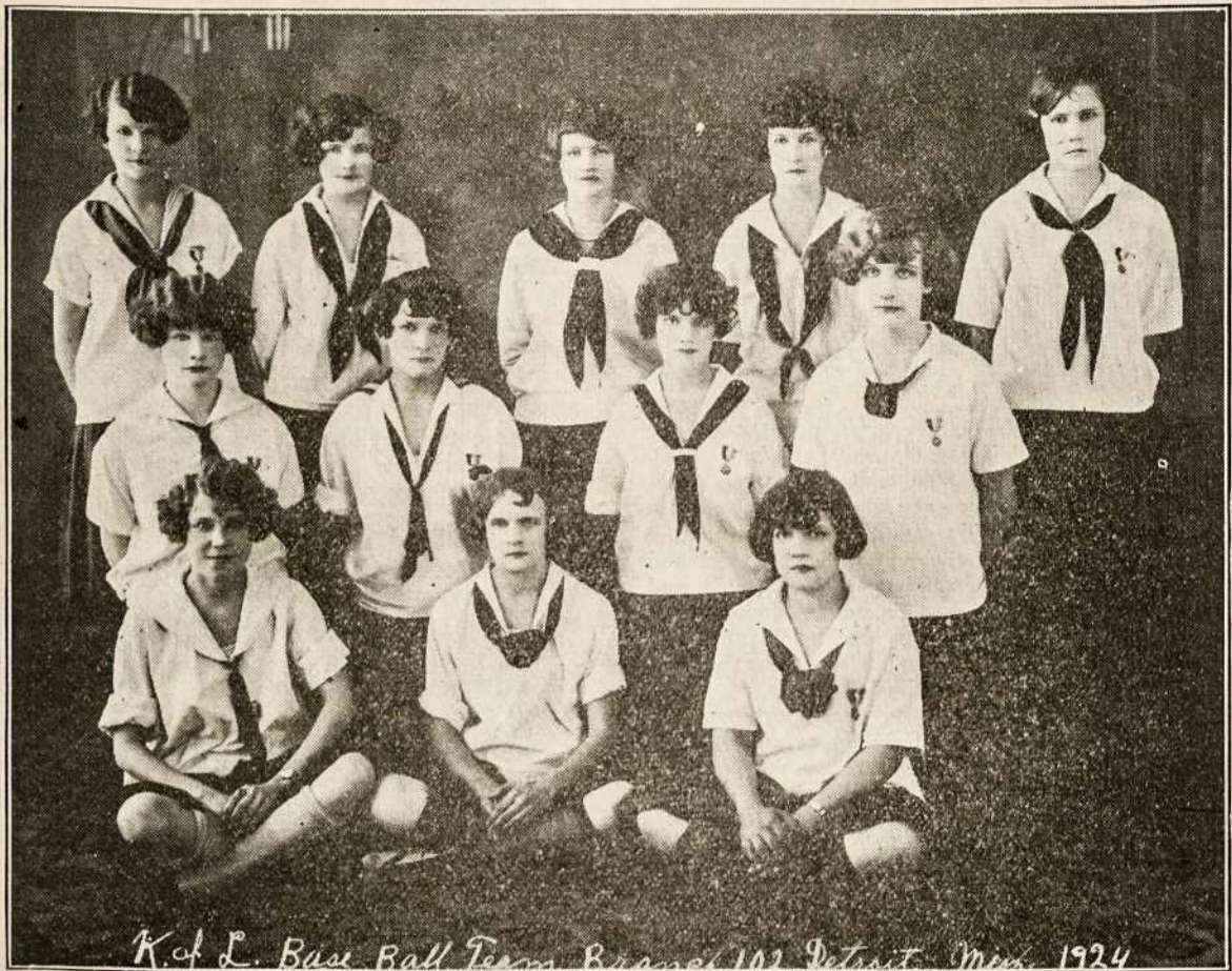
K. & L. Base Ball Team, Branch 102 Detroit, Mich. 1924 L. VYČIŲ 102 KP. MERGAIČIŲ BASEBALL RATELIS, DETROIT, MICH.—WEST SIDE.