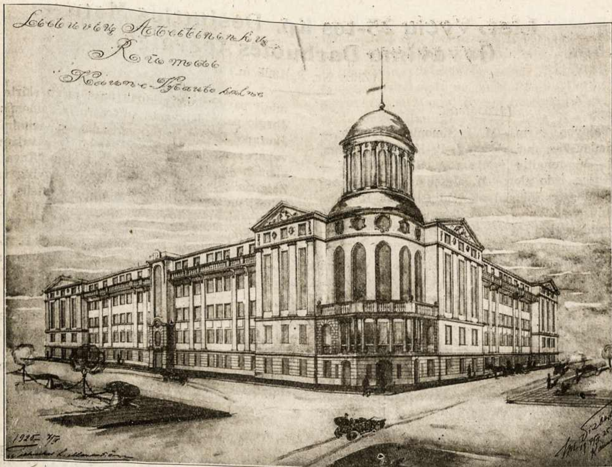
ATEITININKŲ RŪMŲ KAUNE PROJEKTAS.