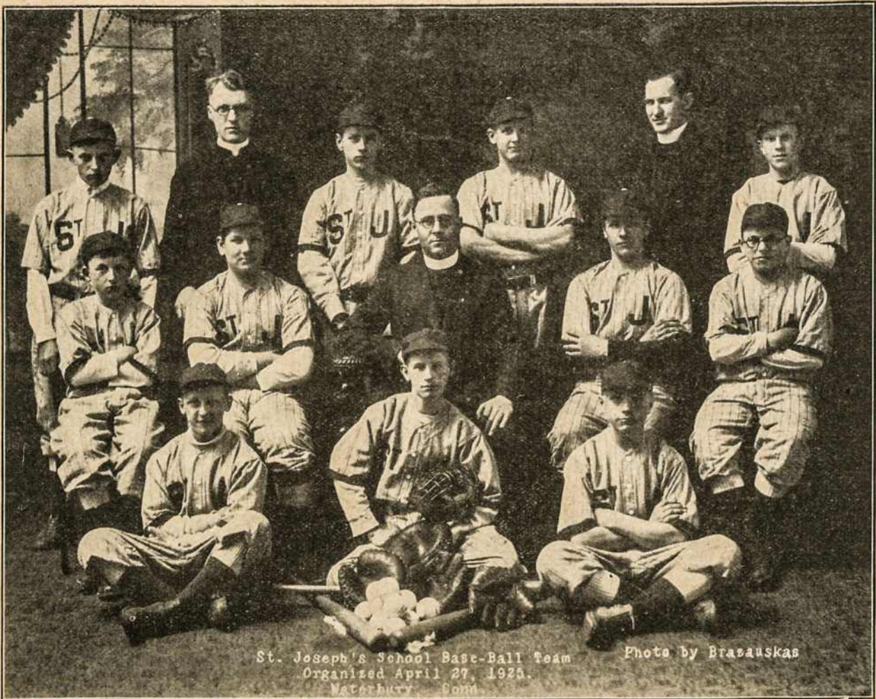
St. Joseph's School Base-Ball Team Organized April 27, 1925. Waterbury, Conn.