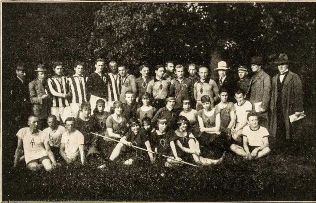
ŽYMESNIEJI LIETUVOS SPORTININKAI-ĖS

brangiais idealais. Tokių vadų Ateitininkija jau ne viena yra davusi lietuvių tautai, ant kurių pečių šiandieną guli visas mūsų visuomeninio ir valstybinio gyvenimo sunkumas. Tačiau eilių eilės ateitininkų dar tebesiruošia tam darbui. Čia ir glūdi visa katalikiškosios visuomenės šios šventės reikšmė. Lietuva gali būti rami, matydama besiruošiant jai vadų kilniosios sielos, nenugalimų pasiryžimų ir užsimojimo nudirbti didžiausius darbus Dievui ir Tėvynei, „viską atnaujinti Kristuje.“