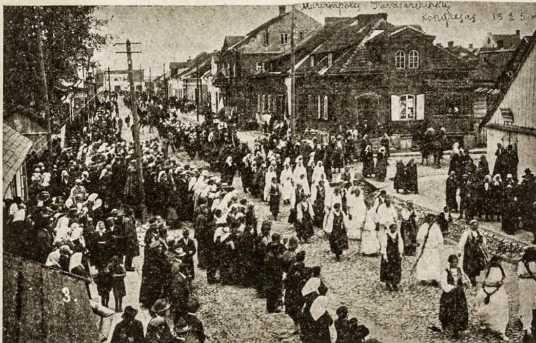
MARIAMPOLĖS RAJONO PAVASARININKŲ KONGRESO 1925 M. "VAIDILŲ GRUPĖ."