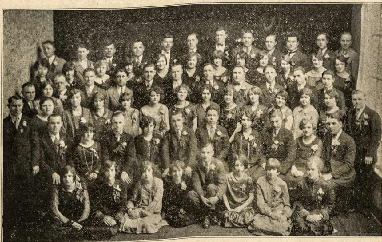
L. VYČIŲ 36 KUOPA, KURIAI ŠIMET SUKAKO DEŠIMTS METŲ NUO JOS IŠIKŪRIMO. JI ŠIAS SAVO SUKAKTUVES APVAINIKAVO LAIMĖJIMU PIRMOS DOVANOS NAUJŲ NARIŲ PRIRAŠINĖJIMO VAJUJE.