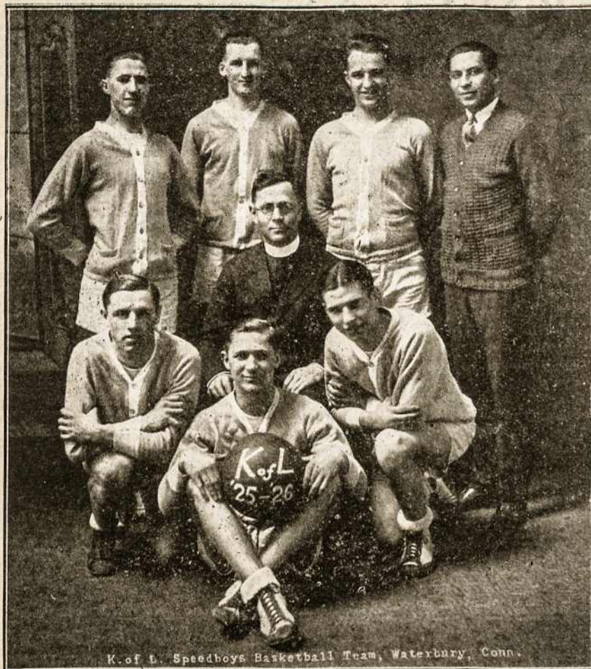
K. of L. Speedboys Basketball Team, Waterbury, Conn.