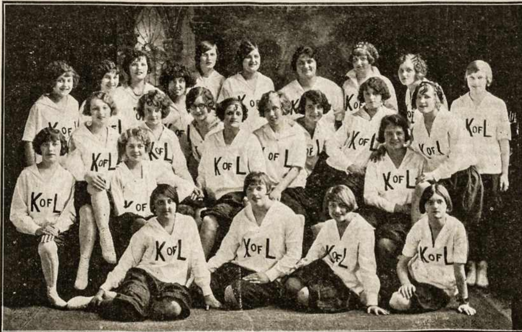
LIET. VYČIŲ 7 KUOPOS MERGAIČIŲ SPORTO SKYRIUS, KURIS VYČIŲ XIV-jo SEIMO LAIKOTARPY RODYS SAVO GABUMUS, WATERBUY, CONN.