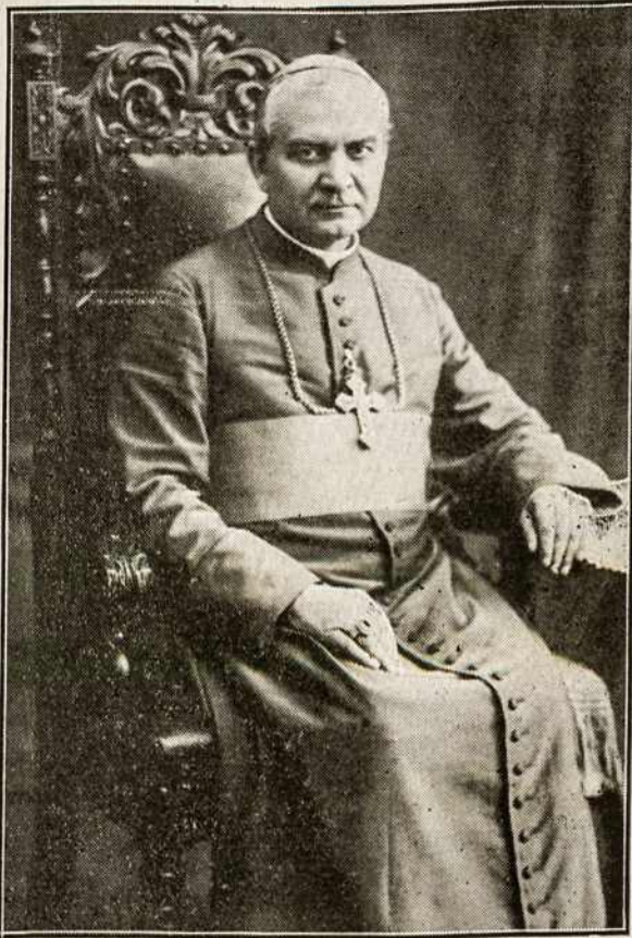
JO EKSCLENCIJA Arkivyskupas JURGIS MATULEVIČIUS.

Apaštališkasis Vizitatorius Lietuvai, buvęs Vilniaus vyskupas, dalyvavęs Eucharistiniame kongrese, dabar lanko lietuvių parapijas Amerikoje, pirmas Lietuvos aukštosios dvasiškos aplankyti amerikiečius. Jo Ekscelecija dalyvaus Liet. Vyčių XIV-jame Seime, Waterbury, Conn. Jis pasižymi giliu atjautimu mūsų tautos jaunimo.