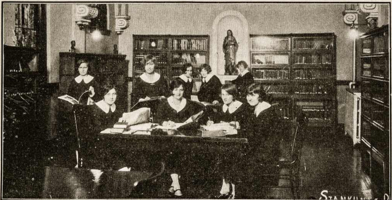
SKAITYKLA-KNYGYNAS ŠV. KAZIMIERO AKADEMIJOS, KURIOS VEDĖJOMIS YRA LIETUVAITĖS ŠV. KAZIMIERO SESERYS, CHICAGO, ILL.