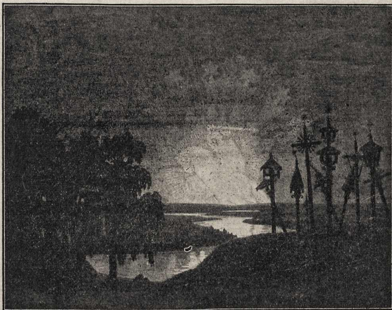
LIETUVA SVAJONĖSE.—A. Zmuidzinavičius