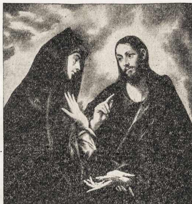
V. JĖZUS ATISISVEIKINA SU SAVO MOTINA ŠV. P. MARIJA.— El Greco