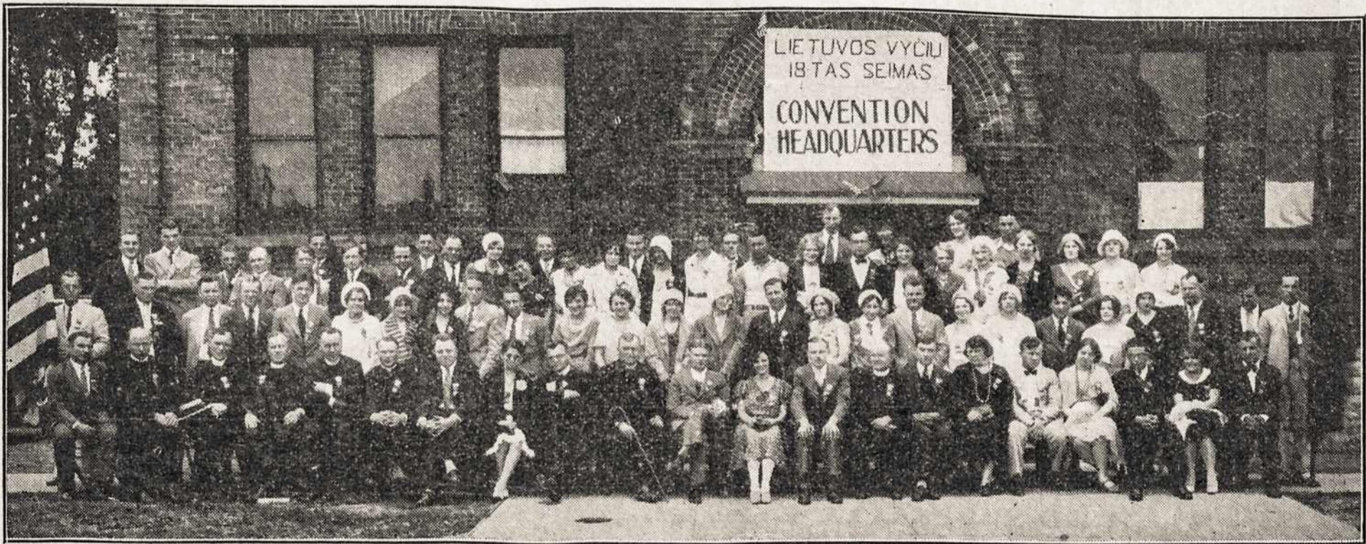
Liet. Vyčių XVIII Seimo, Įvykusio Rugpiūčio 4, 5 ir 6 dd., Kenosha, Wis., Dalyviai-ės