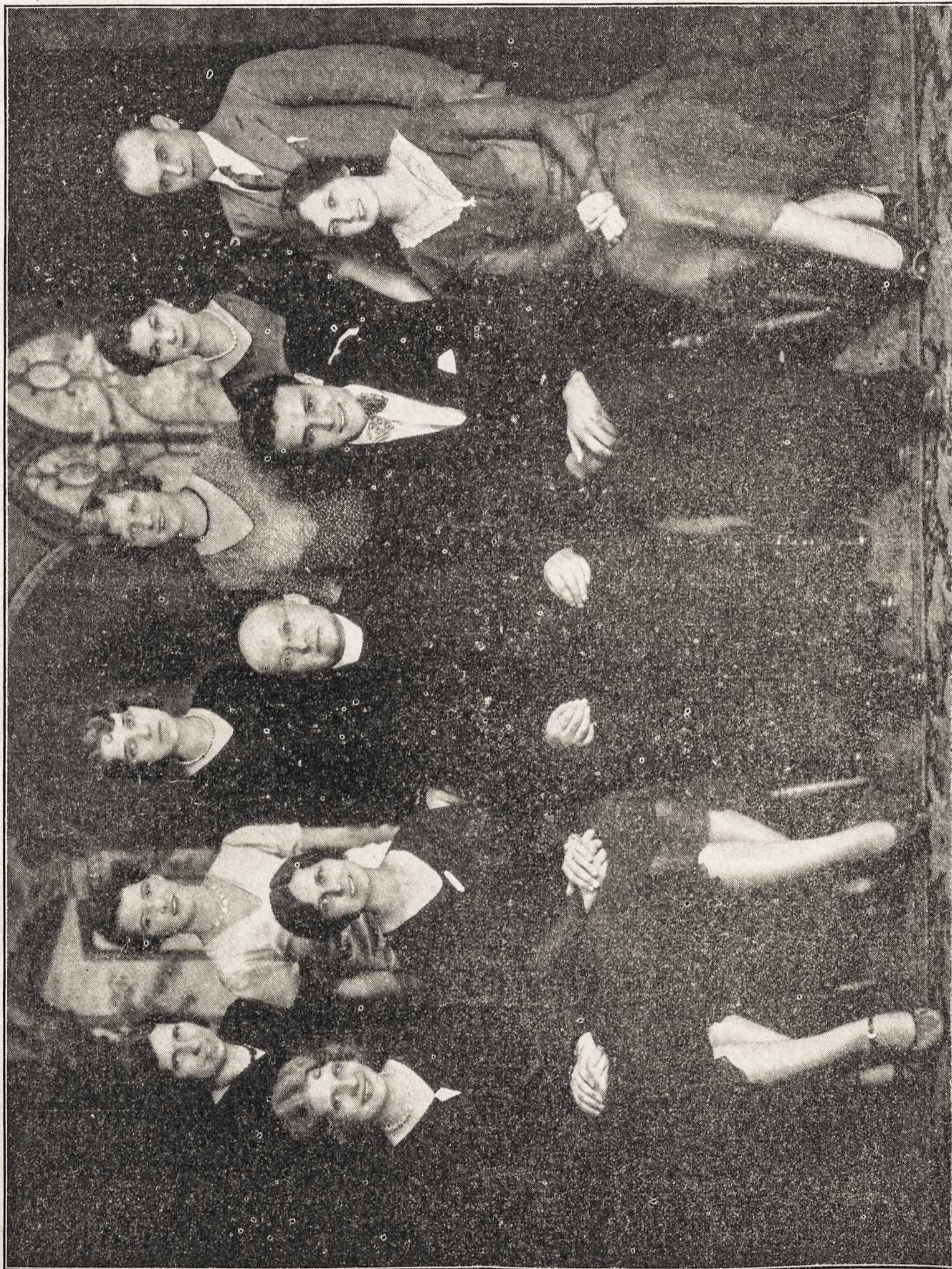
LIETUVOS VYČIŲ 36 KUOPOS JUBILIEJINIŲ METŲ VAIRAS