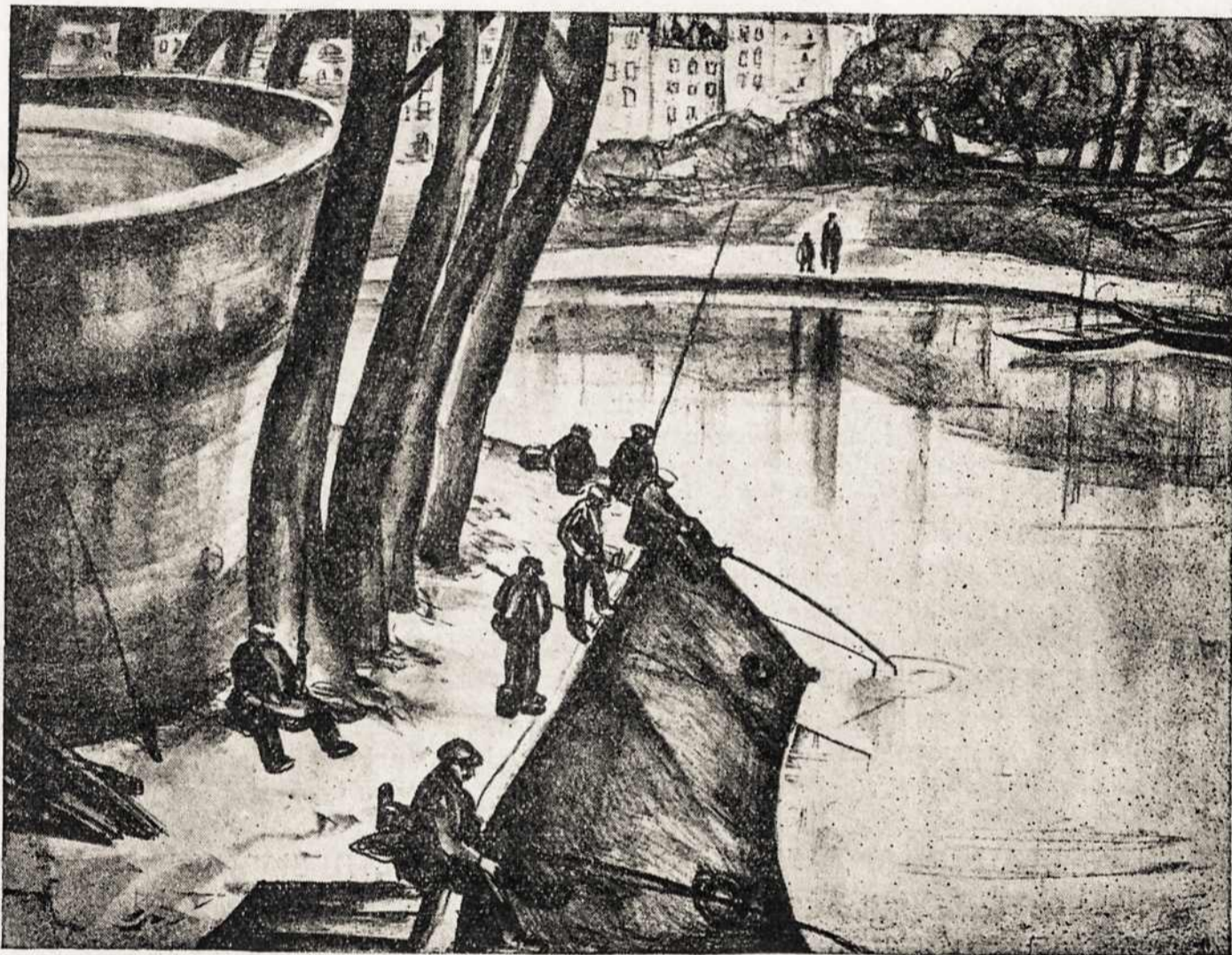
ŽVEJAVIMO SEZONO UŽBAIGIMAS