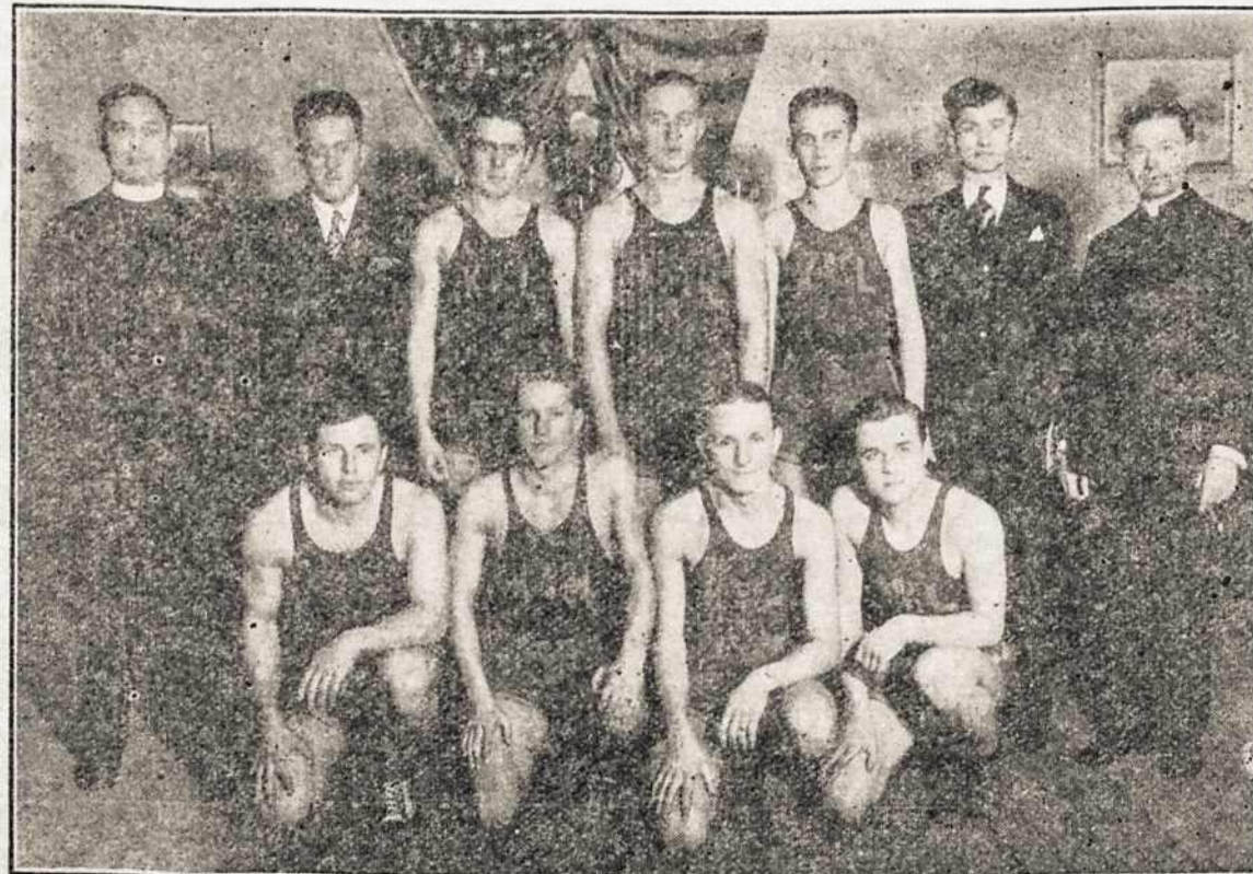
41-os Kuopos Krepšiasvydžio Komanda