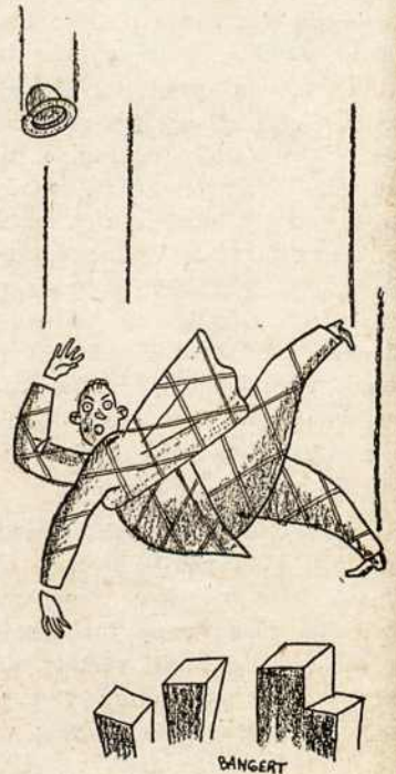
Sad plight of the gentleman who asked the porter to brush him off.