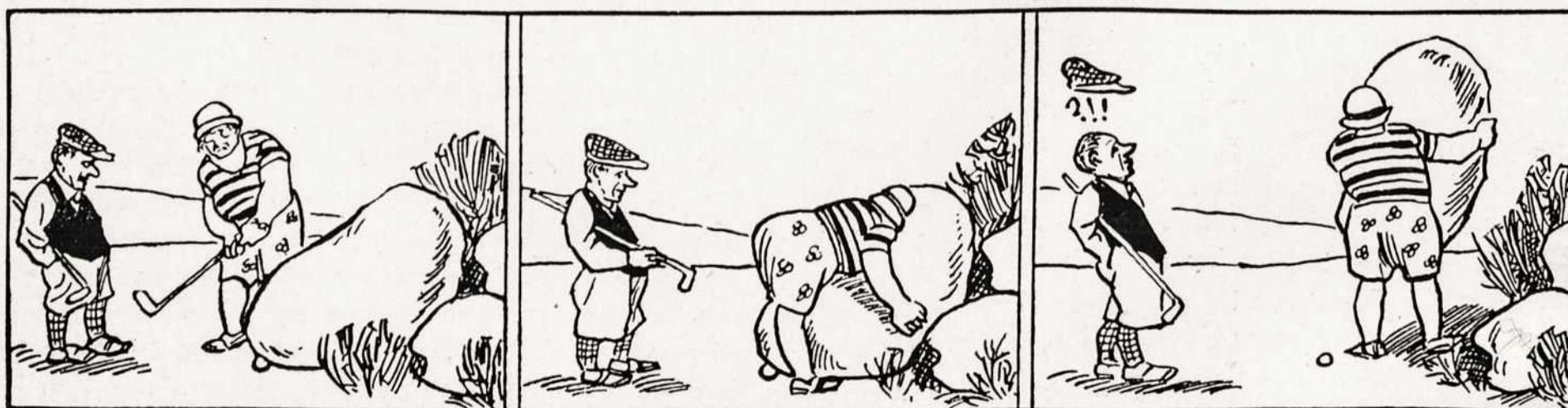
Kokių esama Amerikoj golfistų!... Jiems nėra jokių kliūčių.