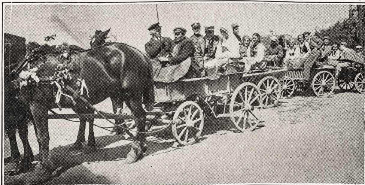
Lietuviški vestuvninkai grįžta iš bažnyčios. Šis paveikslas imtas iš lietuviškos filmos „Onytė ir Jonukas“.