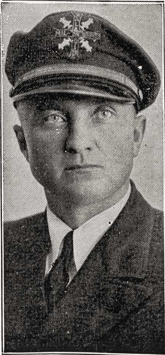
Kapt. Steponas Darius