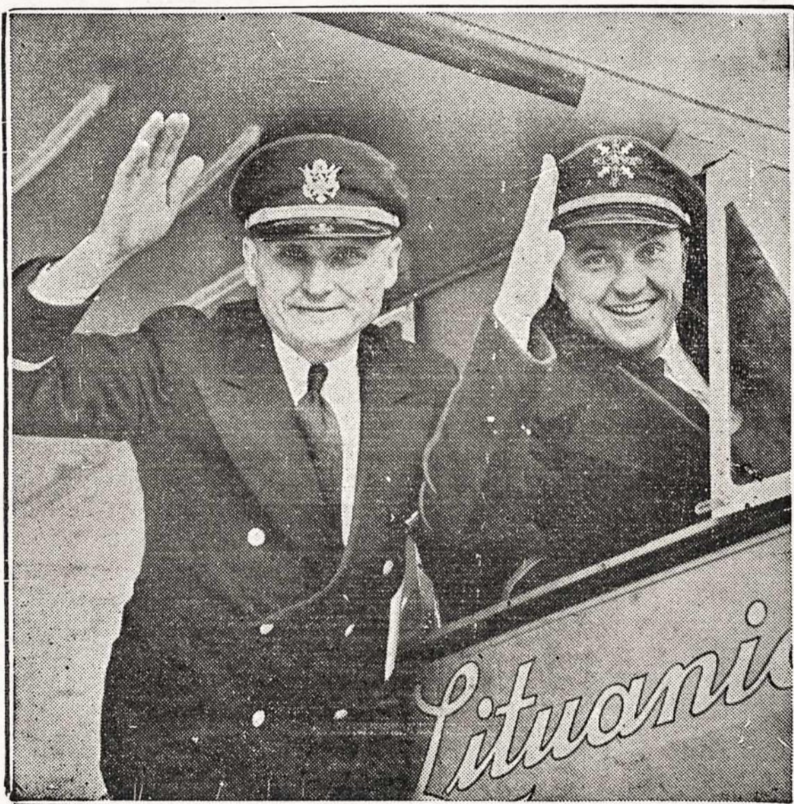
Drašuoliai Atsisveikina su Chicagiečiais