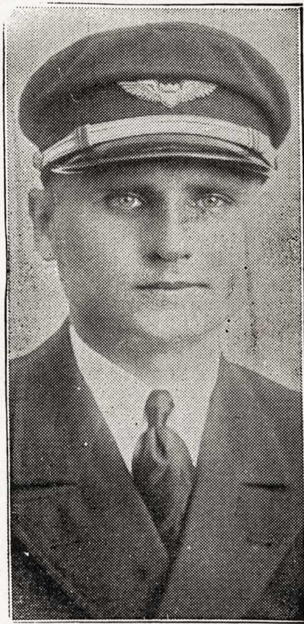
Leit. Stasys Girėnas

Per pėreitus penkioliką Lietuvos nepriklausomybės metų, nebuvo kito tokio įvykio, kuris suįdomintų visą Lietuvos tautą, ir šiapus ir anapus okeano, kaip mūsų didvyrių kapitono Stepono Dariaus ir Stasio Girėno pasiryžimas skristi iš New Yorko į Kauną. Liepos mėn. 15 d. vos saulutei apšvietus Amerikos šalelę, mūsų lakūnai pakilo su „Lituanica“ ir leidosi į tolimą kelionę siekdami naujų laurų Lietuvos tautai.