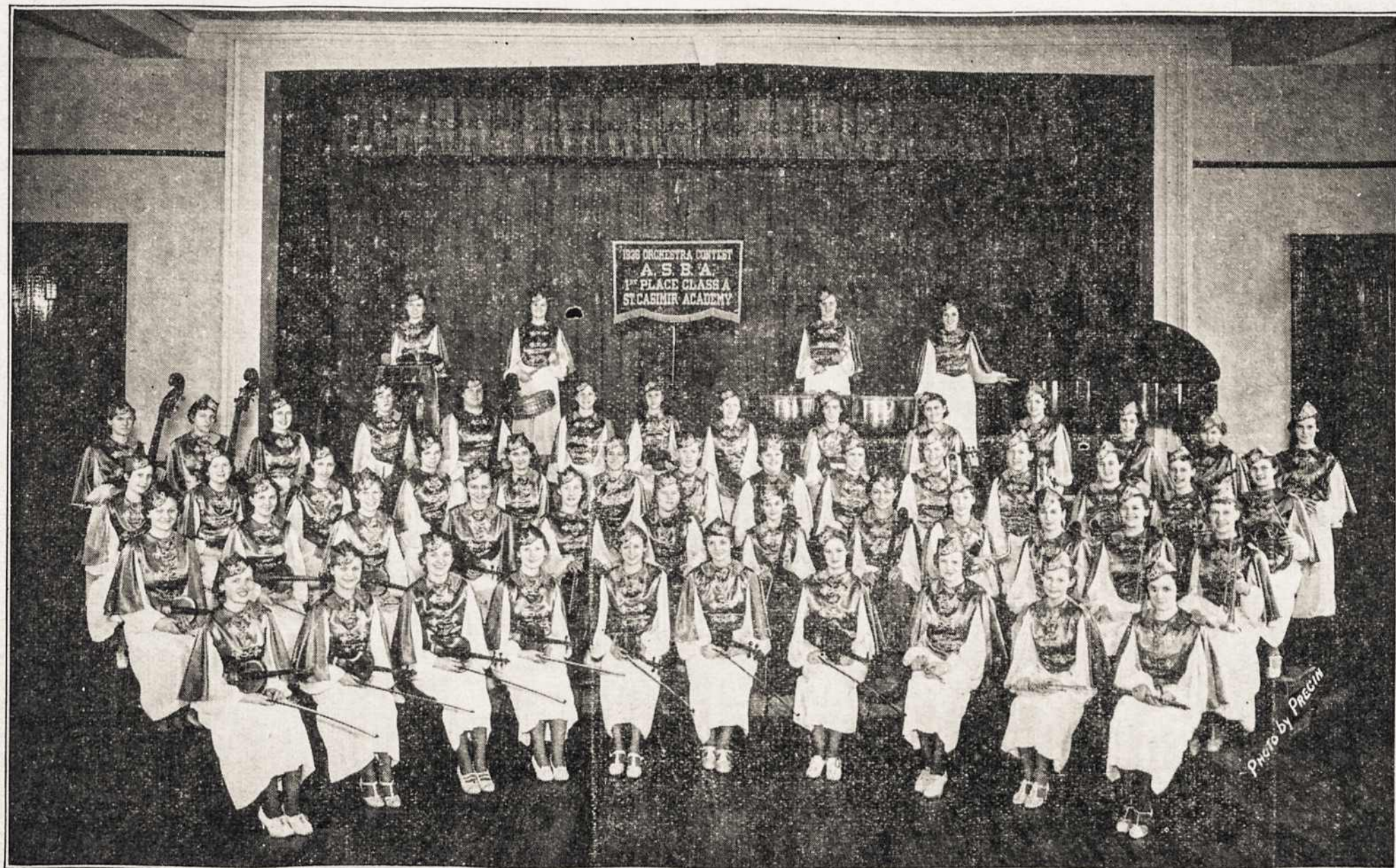
PRAŠOME SUSIPAŽINTI SU ČEMPIJONĖMIS! TAI ŠV. KAZIMIERO AKADEMIJOS ORKESTROS DALYVĖS, LAIMĖJUSIOS PIRMĄ DOVANĄ CHICAGOS ARKIDIOCEZIJOS ORKESTRŲ KONTESTE.

Taigi, dainininkai, chorai, vargouninkai, visuomenės veikėjai, draugijos ir visuomenė, skirkite savo auką, o paminklas galima bus neužilgo su didelėmis iškilėmis atidengti.