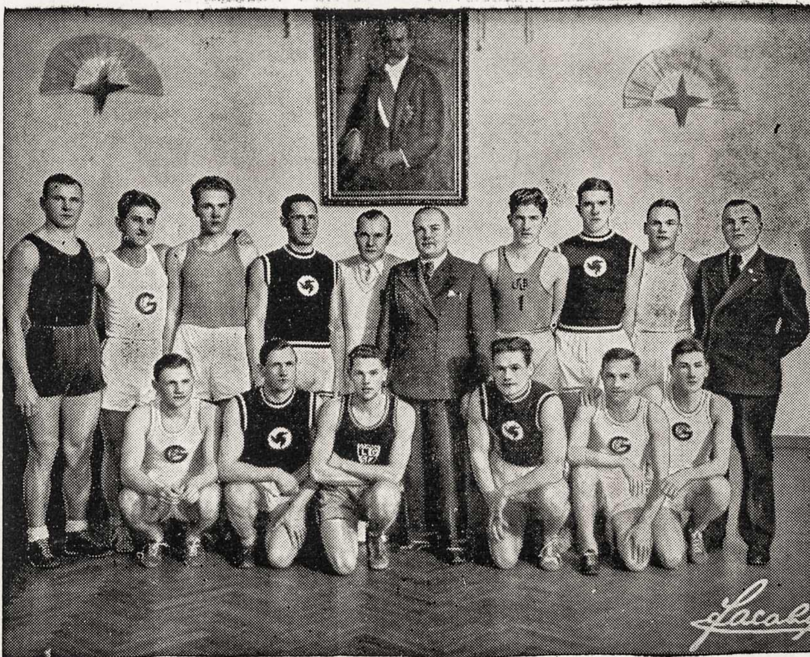
LIETUVOS SPORTININKAI, KURIE LANKYSIS AMERIKOS LIETUVIŲ KOLONIJOSE ŠIA VASARĄ