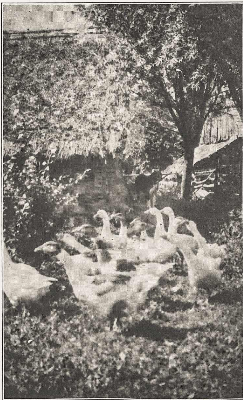
„PASKUI ŽASELĒ IR ŽASINĒLIS“...