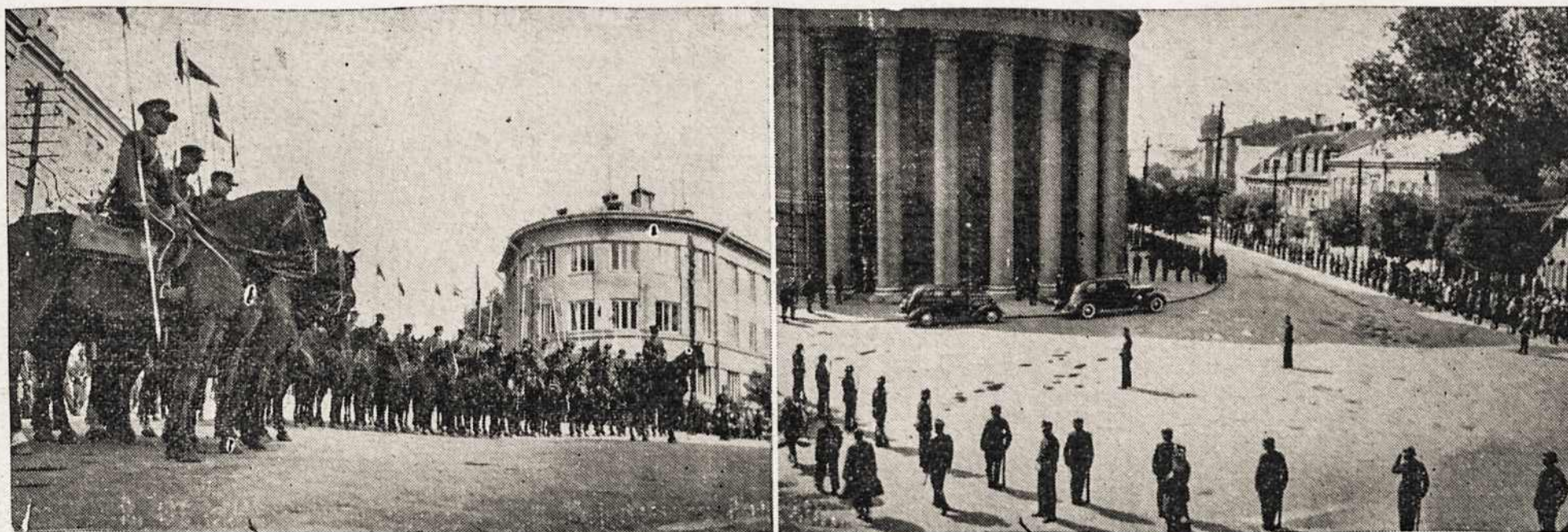
LIETUVOS KARIAI PASIRENGĘ SUTIKTI SAVO VYRIAUSYBĘ KAUNE.