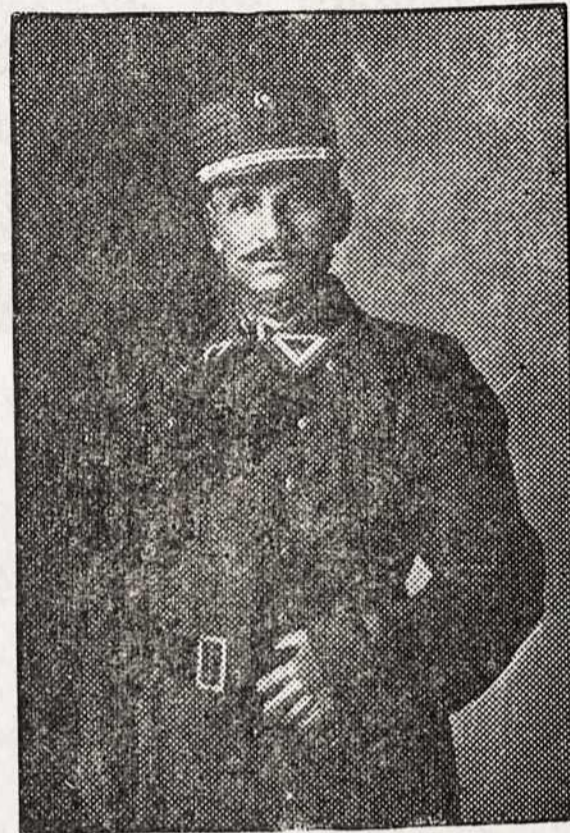
GEN. S. ŽUKAUSKAS kuriam už didelius nuopelnus kovose dėl Lietuvos laisvės Liet. Vyčiai yra padovanoję aukso kardą.

ŽIEMAI UŽĖJUS vien tik iš Kauno vokiečiai išsiuntė 1,500 gyventojų į miškus malkų kirsti. Ši prievolė palietė tiek darbininkus, tiek įstaigų valdininkus.