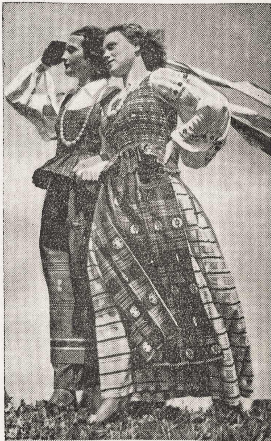
Giedu dainelę, savo giesmelę