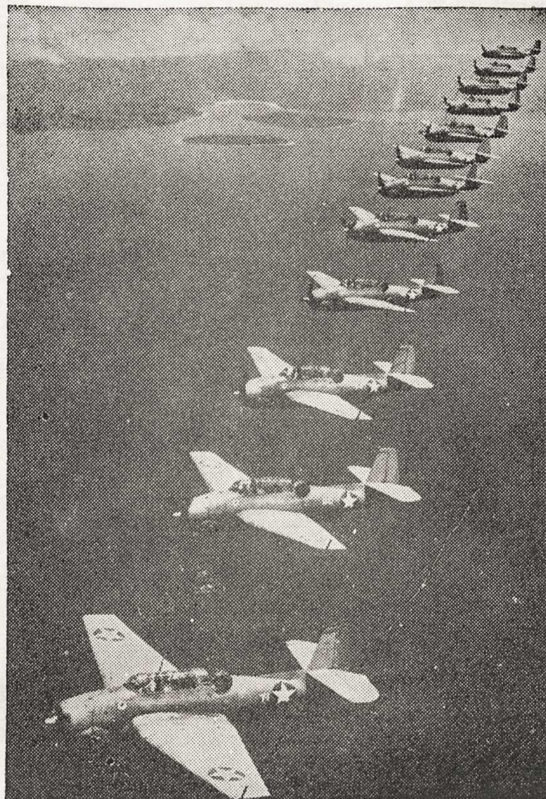
SPIRIT OF THE DAY...