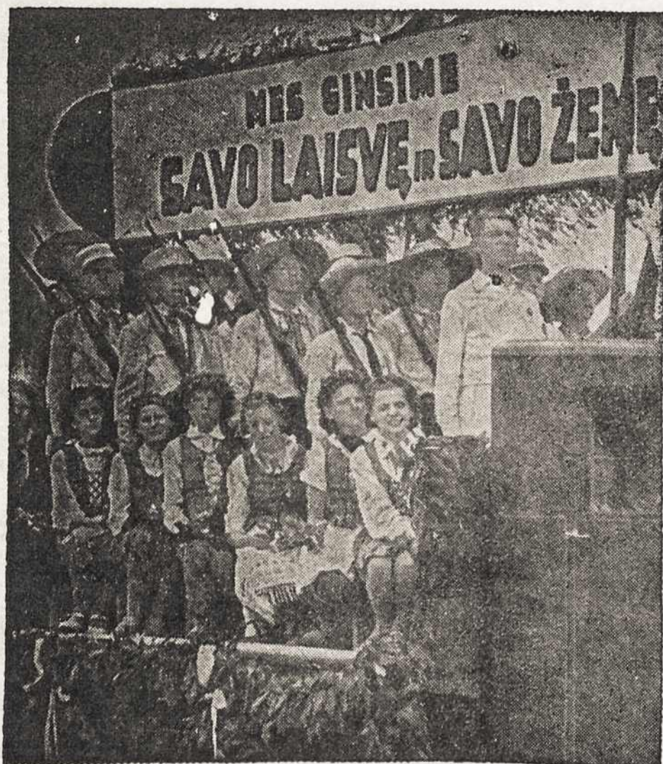
Lietuvos Jaunimas Kauno gatvėmis