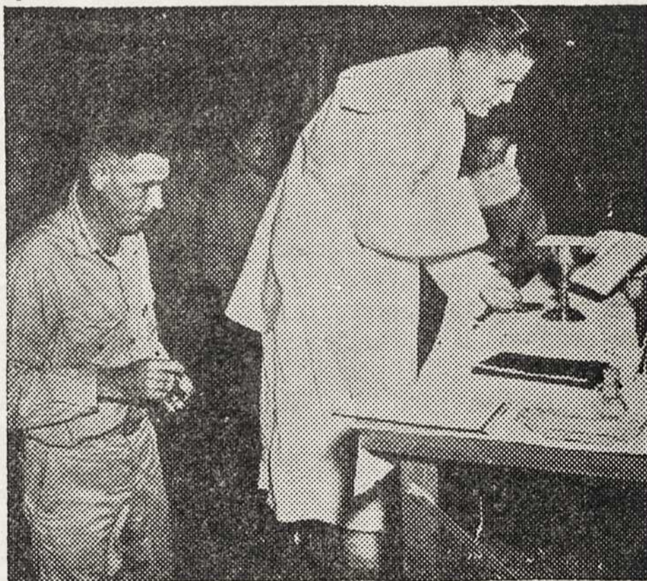
Mišios karo lauke kur nėra žaliuojančių eglaičių ir kur sidabrinės snaigulės niekad nekrinta.