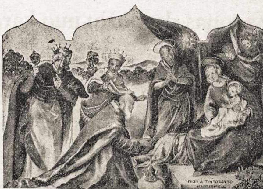
Trys Rytų Išminčiai sudeda savo dovanas gimusiam Kūdikėliui Jėzui.

ne nauji. Pats didžiausias darbas — auginti organizaciją. Jei įžengė į Naujus Metus su didesniu pasiaukojimu, su didesne energija ir meile tai darysime, ne tik organizacija augs, bet sklės ir mūsų laikraštis — „Vytis“, kuris kaip tik ir yra didžiausias visų mūsų darbų talkininkas.