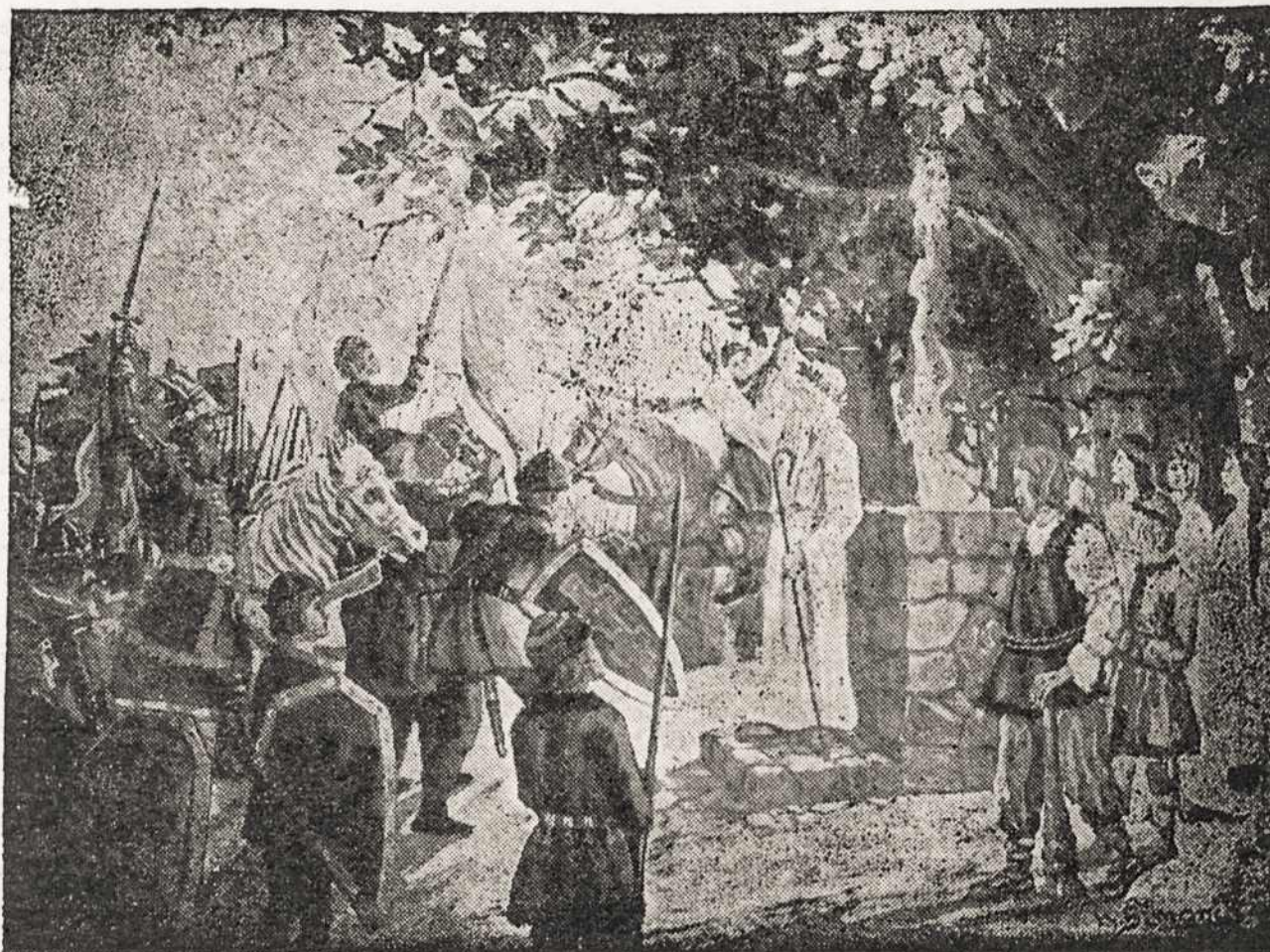
Senovės Lietuvoje Vyriausiasis Žinys laimina šalies karius išvykstančius ginti tėvynę nuo užpuoliku.

With that we challenge anyone to say that that is not an all-star cast. All in all, its an uproariously funny play, and anyone planning an evening of fun will do well to have himself and his whole family comfortably ensconced in their seats by 8 o'clock, which is curtain time. After the play