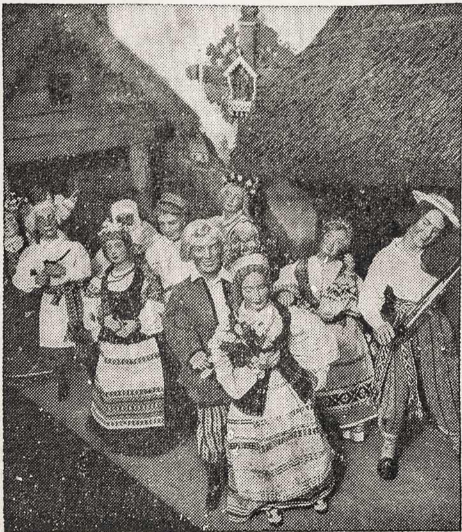
Lietuviškais tautiškais kostiumais parėdytos žmogystos-lėlės, kurios buvo išstatytos Pasaulinėje Parodoje, New Yorke, kaip pavizdys Lietuvos liaudies tautinių drabužių. Vaizduojama vestuvės ir kaimo muzika.

4. Kovoti su gyvenimo nepadorumais : Pažinti gerus judamus paveikslus, žinoti geras knygas.