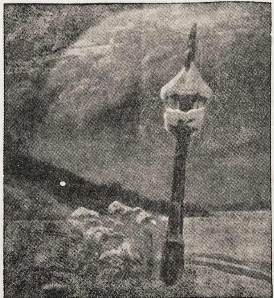
Vienišas Lietuvos laukų ištikimas sargas...

"American Catholics would ever resent their country's being made a party to the de-Christianization of historic Catholic peoples."