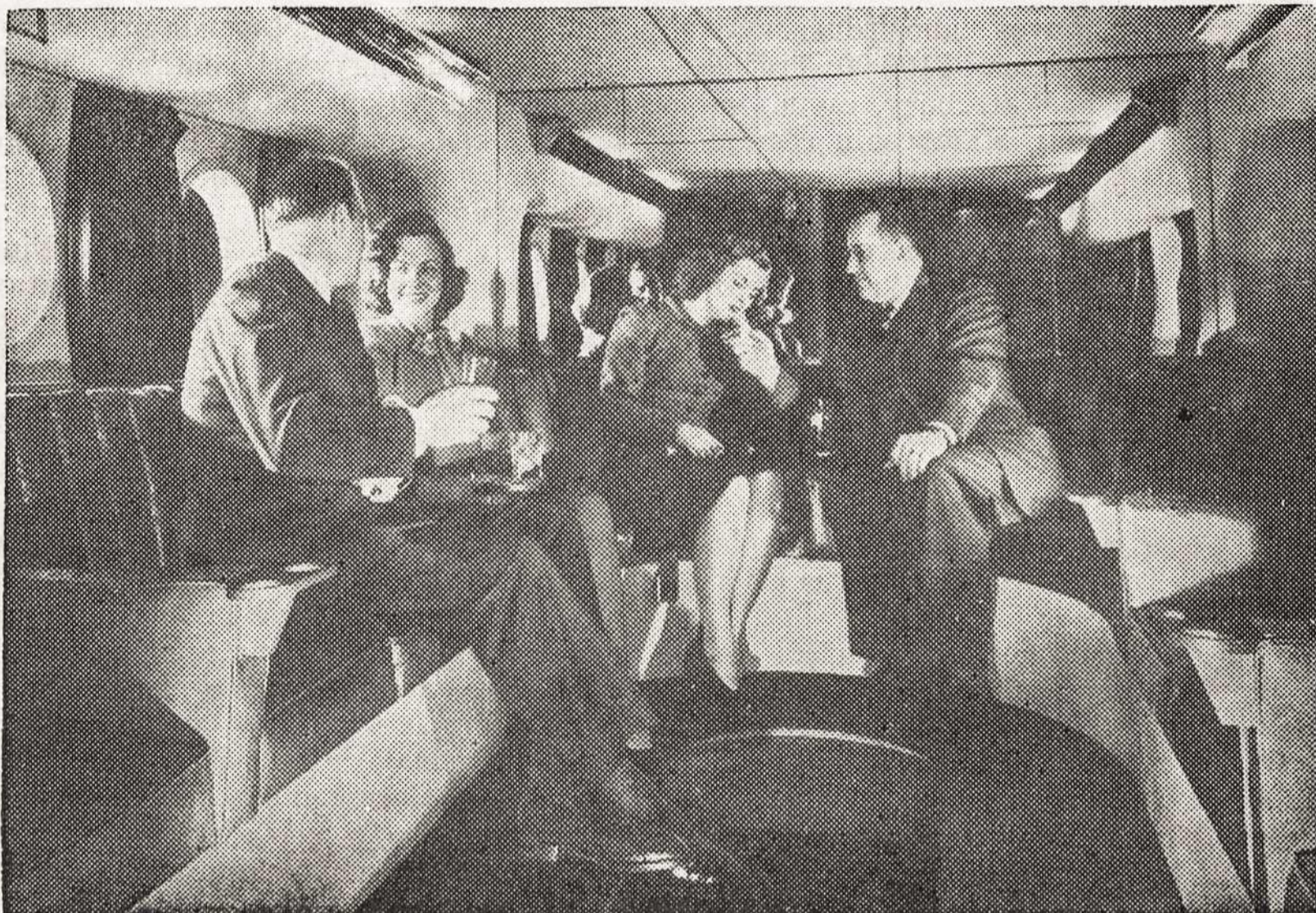
TRAVEL DELUXE — Passengers relax in comfort in smart cocktail lounge on new double-decker airliner Stratocruiser. Total of 81 passengers are accommodated on plane and there is 900 cubic feet of storage space for baggage. Seats in upper deck are converted into berths.