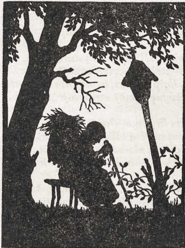
Vargelyj — Ramintojėlis...

siai apsnūdus, šimet pažadinta iš miego. Prie to labai daug prisidėjo įsteigta Liet. Vyčių Sendraugų (Seniors) kuopa. Dedama pastangų ne tik atgaivinti visas kuopas, bet ir sutraukti josna kuodaugiausiai jaunimo.