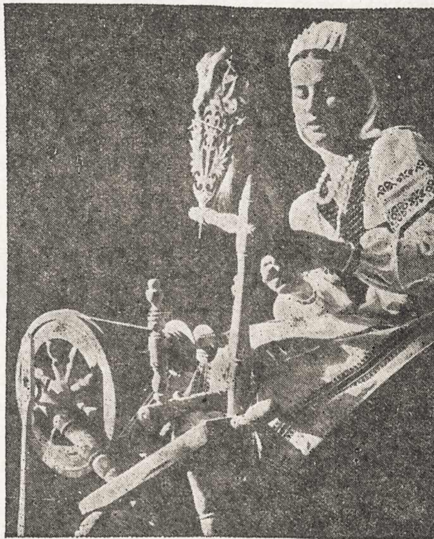
Pirmyn, pirmyn jauni draugai, saulėti mūs takai!

● MR. CHURCHILL PASIAIŠKINO. — Savo kalbo- je Waldorf - Astoria Hotel, New York, N. Y. kovo 15, 1946, Mr. Winston Churchill pasakė: "There is no reason why Russia should feel "ill-rewarded"... In the West the Baltic States and a large part of Finland have been re- incorporated in Russia..." Tokis pasisakymas skambėjo dviprasmiškai ir jam buvo padarytas priekaištas, kad