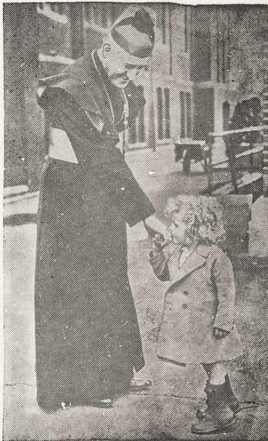
J. E. ARKIVYSKUPAS CUSHING, D. D., lankydamas diecezijos parapijas teikiant Sutvirtinimo Sakramentą, tarp suaugusiųjų, sutinka ir mažiųjų, kurie turi džiaugsmo pabučiuoti jo arkivyskupišką žiedą.

Svečių tostai už Lietuvą, lietuvių tostai už antrąją mūsų tėvynę USA, už Latviją, Estiją ir t.t. Slovakų atstovo tostas už Jungtines Europos Valstybes. Prasideda sutartinės, kurios aidai per tris sales. Įsisiūbuojama taip, kad užsimirštama kasdieninė tema: prisivalgyti, išgerti... Beja, tą dieną ir to netruką. Bet mieliau: "Leiskit į Tėvynę, leiskit pas savus... Svetima padangė nemaloni ne, tėviškė brangi vis regiu sapne." — Vieną dainą baigiant kitą pradendant vėlus laikas arba ankstyvas rytas ragino skirstytis. Pirmoji tremtinių lietuvių tikrai laisvai atšvęsta tautinė šventė prabėgo kaip sapnas, palikdama neužmirštamus įspūdžius.