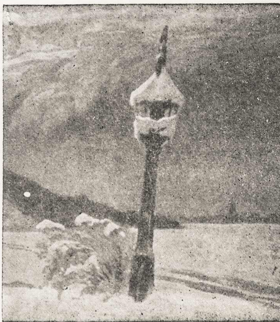
Lietuvos lygumose, — vienišas Smūtkelis

It is, therefore, evident that the objection offered is fallacious. It is, in fact, contrary to every principle of right living. For that reason, it is imperative that we act immediately. Delay will serve only to strengthen the opposing forces. Some time ago, a non-Catholic government official made a statement to the effect that almost 70% of the unofficial mail addressed to the President was coming from subversive elements