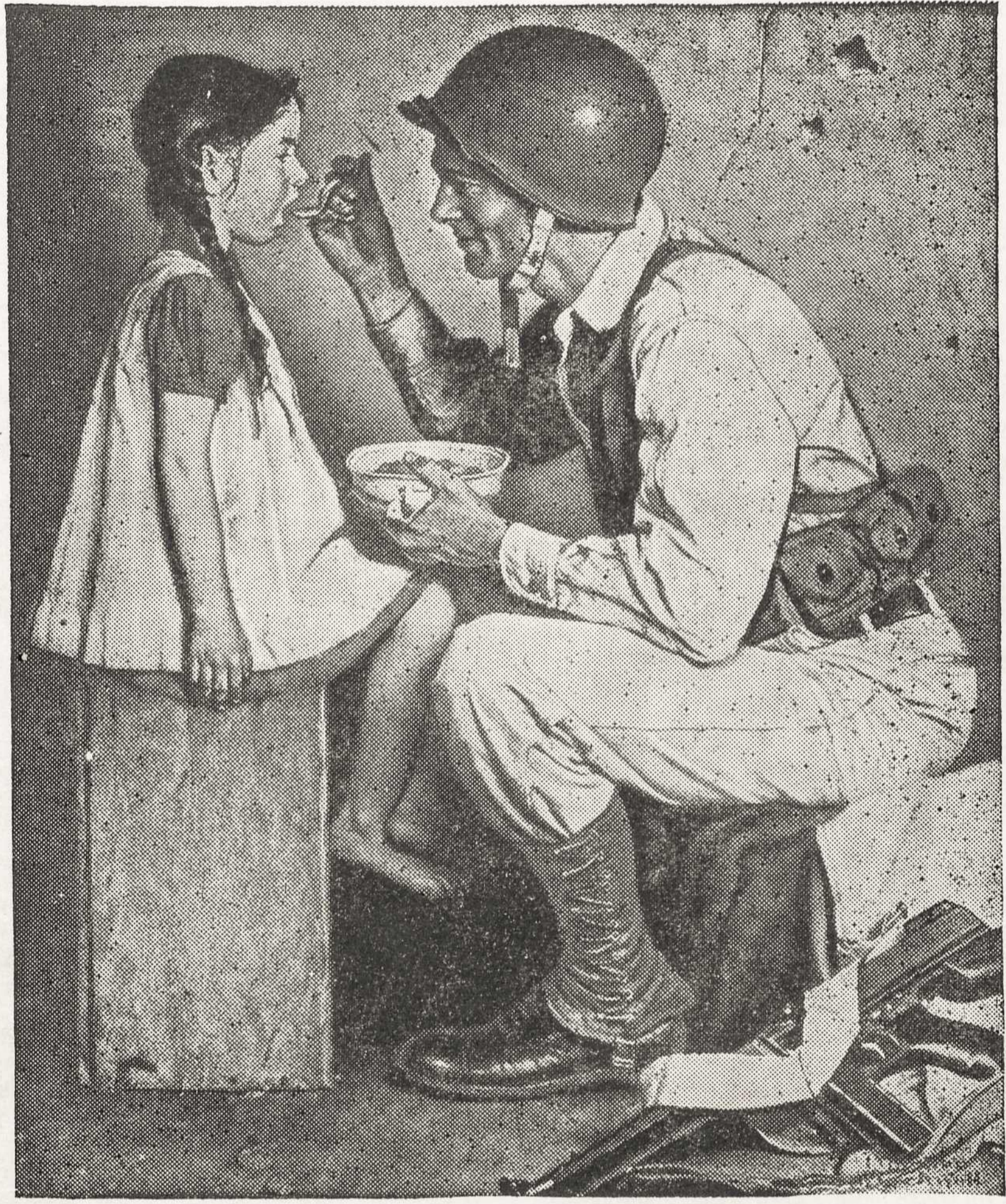
Amerikietis karis Vokietijoje, artimo meilēs apaštalas...