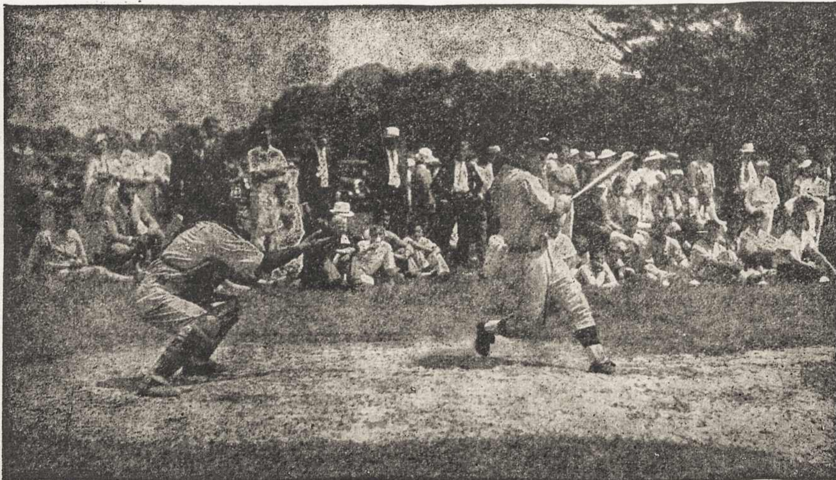
Vyčiai ir Studentai baseball rungtynėse, Marianopolio Kolegijos parke...

Kokios gerosios lietuvių ypatybės? Jau senovėj, kaip istorija pasakoja, lietuviai buvę sveiki, stiprūs ir ištvermingi. Atsiminkime, kap Žalgirio mūšyje, kai Lietuvos kariuomenė neteko ginklų, rovė su šaknimis medžius ir pliekė kryžiuočius. Sakoma, kad lietuvius pati gamta užaugindavo fiziškai stiprius, nes mūsų kraštas senovėj buvo apaugęs giriomis ir priversdavo jos gyventojus tu tomis nykiomis giriomis kovoti. Juk nebuvo tada tinkamų priemonių, o vis dėlto sodybas prasiskindavo didžiausiuose tankumynuose. Ši-