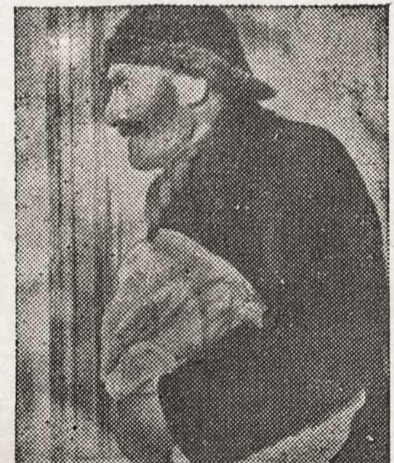
FISHERMAN, 74, of Abolands Islands, Finland, clutches garments made by volunteers of Chicago Red Cross chapter.