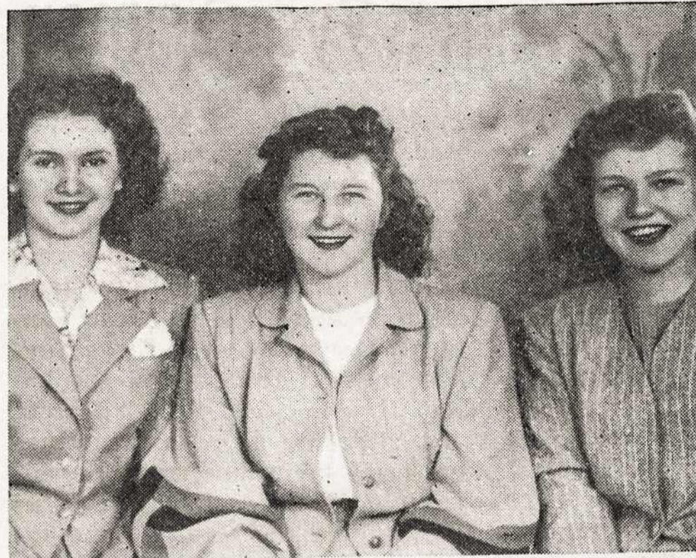
Jaunųjų Vyčių Vadovės

Padėkojau jaunai sekretorei už malonų papasakojimą, linkėdamas sėkmingai ir toliau dirbti, kad Seimas tikrai būtų naudingas ir įvairus.