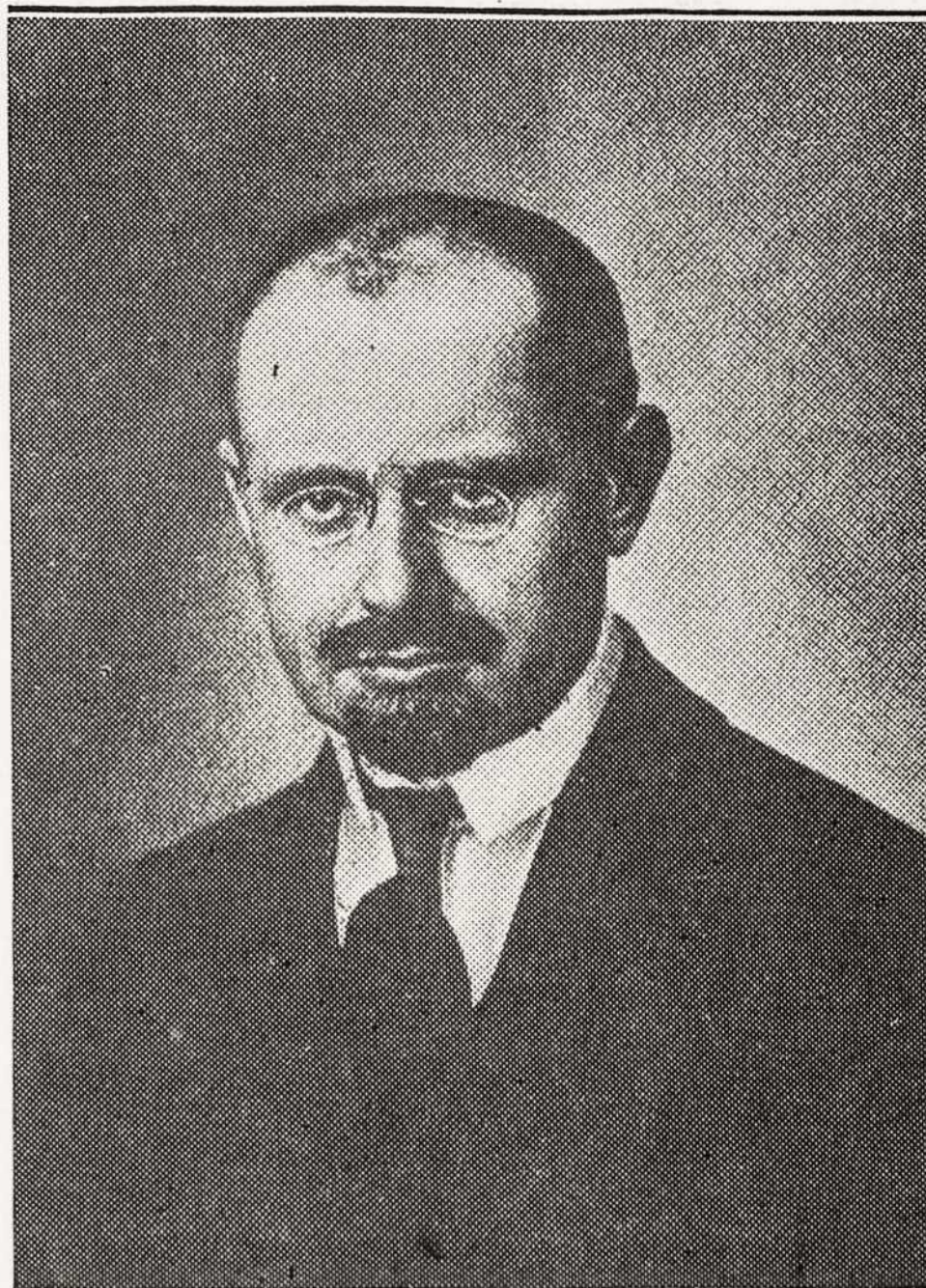
ALEKSANDRAS STULGINKIS Miręs Sibiro Tremtyje

Su a. a. Stulginskiu susipažinau 1919 m. pavasarį. Atgavus nuo latvių Palangą, Stulginskis vasaros vakacijas praleisdavo Palangoje. 1922 m. man studentu esant tekdavo su kitais studentais užėiti į jo paprastus namus Palangoje, ant plažo nuotaikingai ir linksmai su juomi pasikalbėti. Prie jo durų nebuvo jokios sargybos , niekas nesaugojo jo besimaudant ir po Palangą ir Kauną vaikščiojant. Man gyvenime teko buvoti bent pas penketą kitų šalių prezidentų. Jų sargybos pir-