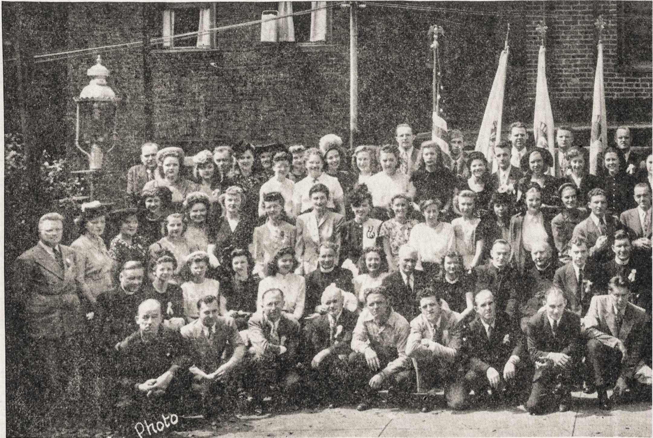
Lietuvos Vyčių 34-to Seimo, Philadelphia, Pa