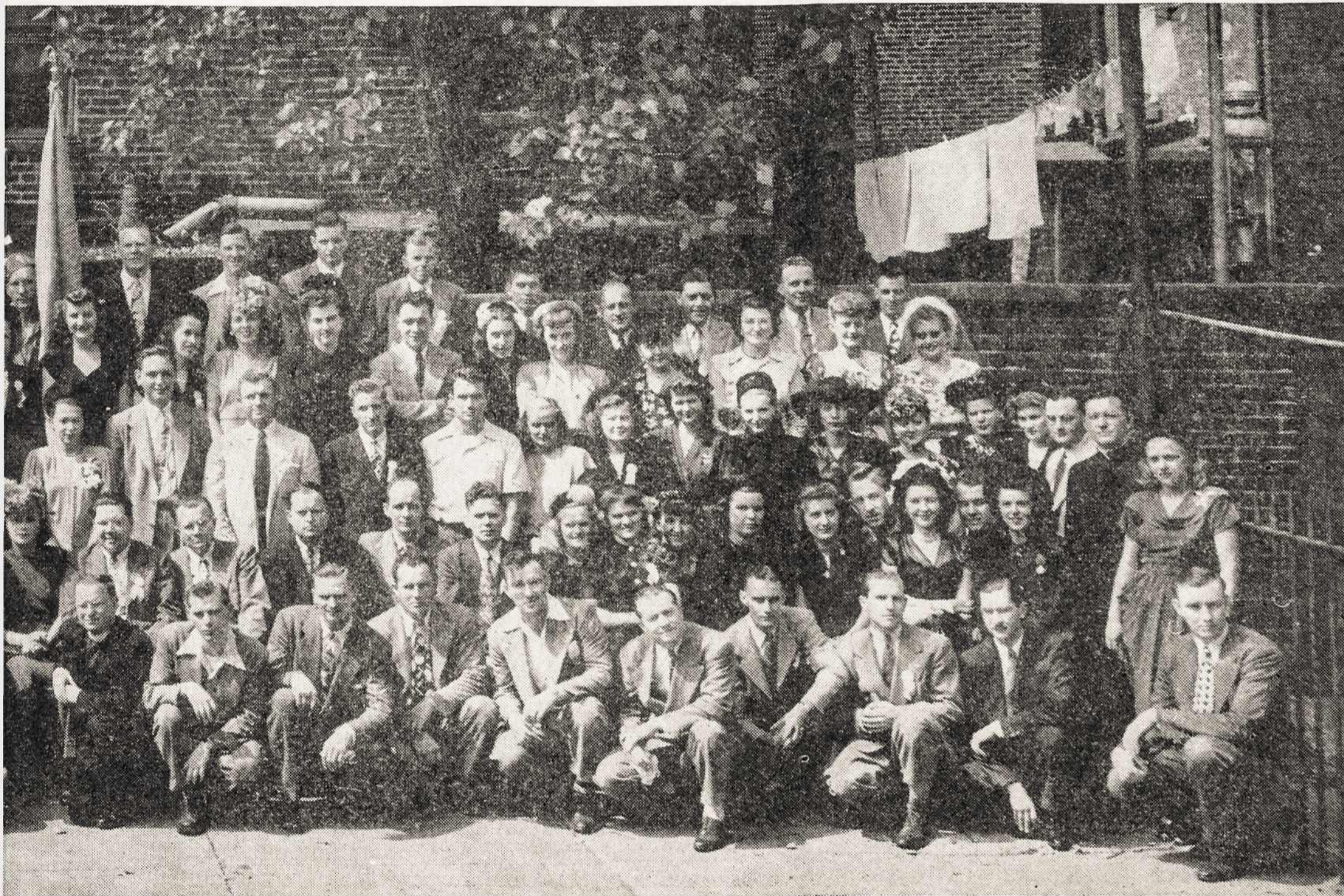
, delegatai, kuris įvyko rugs. 12-14 d., 1947 m.