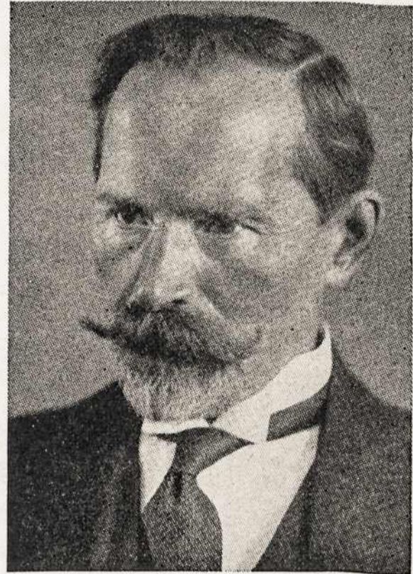
A. Smetona, first president of Lithuania.