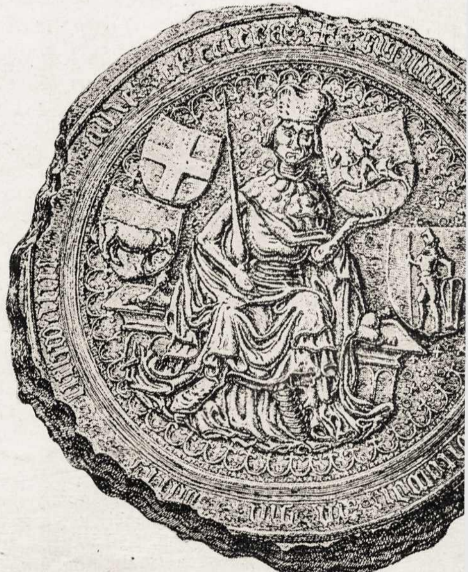
The majestic State Seal of Vytautas The G