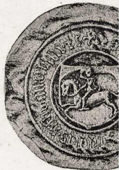
Seal of King Casimir