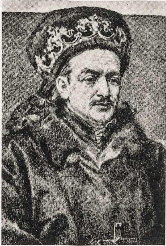
King-Grand Duke Casimir (1492), father of St. Casimir.