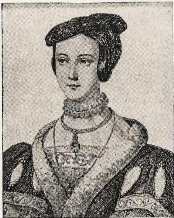
Queen-Grand Duchess Barbara (1551) of Radzivilas family, wife of King Sigismundus Augustus.