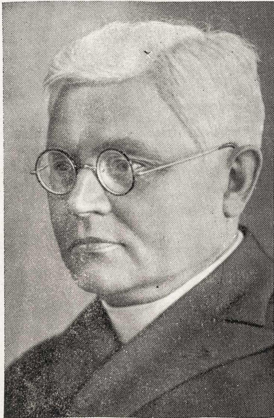
Kan. Juozas Tumas-Vaižgantas

Lietuvių literatūroje kan. Juozas Tumas Vaižgantas yra minimas kaip "Pragiedrulių", "Dė-