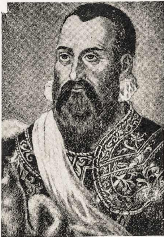
Prince Radvilas The Black, Marshal of Lithuania, Chancellor. Died in 1565.