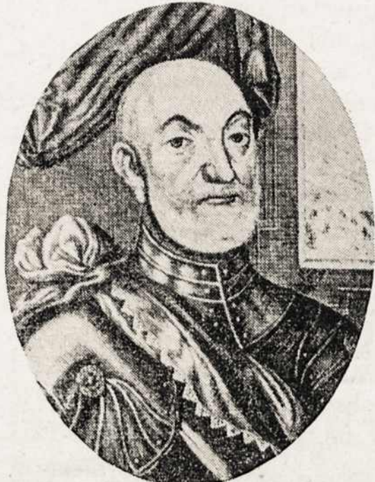
Prince Leo Sapieka, Chancellor of Lithuania. He prepared the famous third Lithuanian Statute (1588).