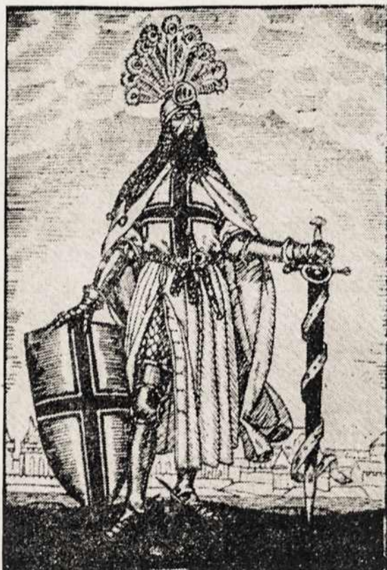
Teutonic crusader (Kryžiuotis).