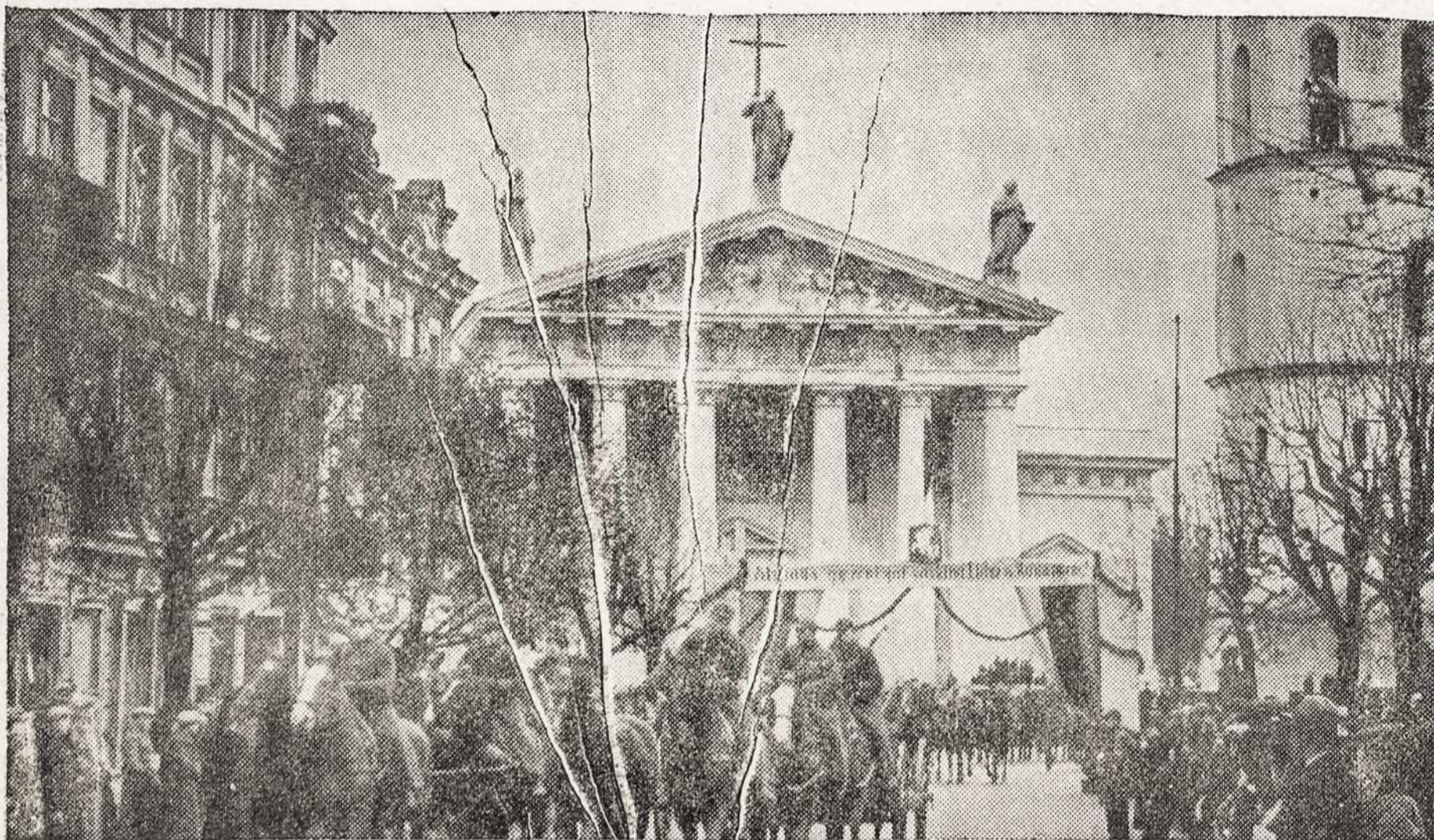
Laisvosios Lietuvos kareivėliai atvaduoto Vilniaus gatvėmis...

šalia manęs, įsikūrė bolševikų kariuomenės štabas. Visi gyventojai, išskyrus mane, buvo iš jo išvaryti.