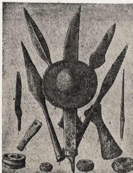
XIII-IX century iron articles excavated in Lithuania.