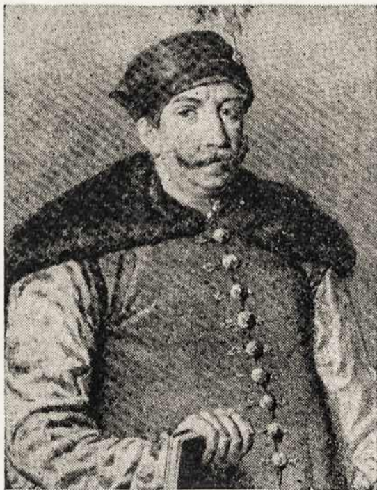
Prince Christopher I Radvilas "The Thunder", Field Hetman of Lithuania (1603).