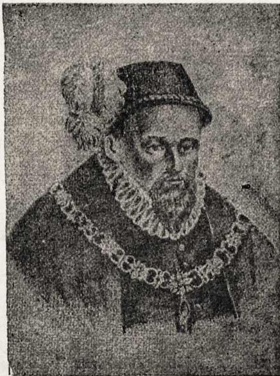
King-Grand Duke Sigismundus