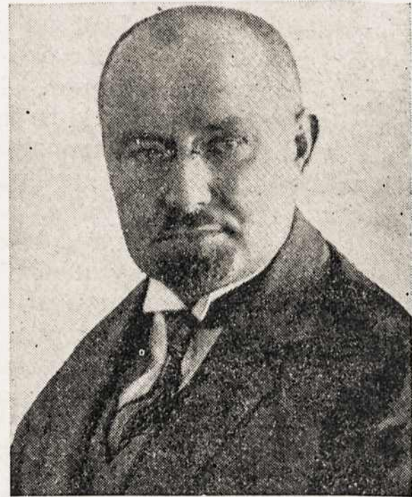
A. Stulginskis, second president of Lithuania.