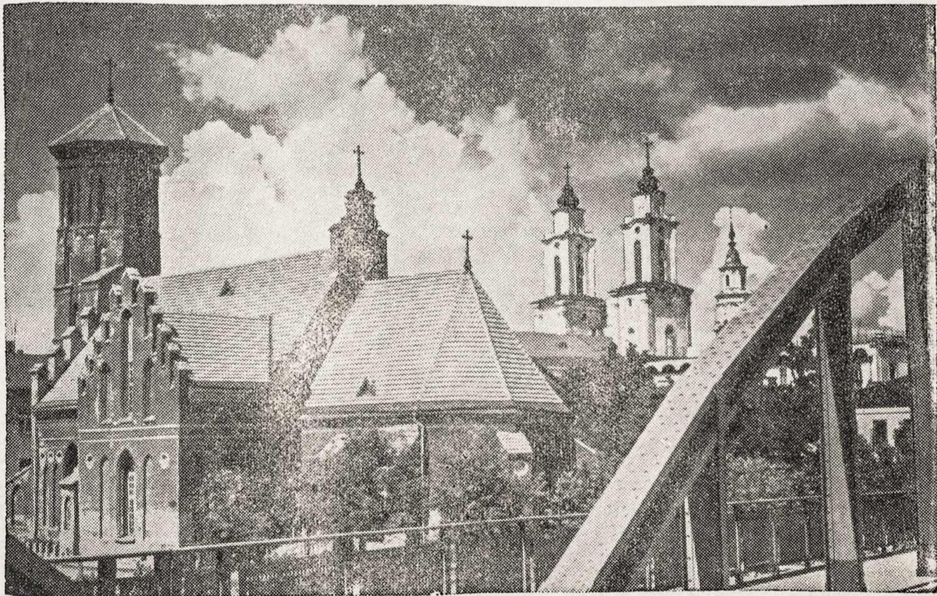
Vytauto Didžiojo bažnyčia Kaune, kurioje ilgą laiką klebonavo kan. Juozas Tumas Vaižgantas.

Jo asmuo, darbai ir saulės šviesos nužerti jo kūriniai šiandien mums tebėra toki gyvi, nepainiomai ir širdžiai artimi, kaip ir anomis dienomis, kada žavintis Vaižganto asmuo buvo mūsų tarpe.