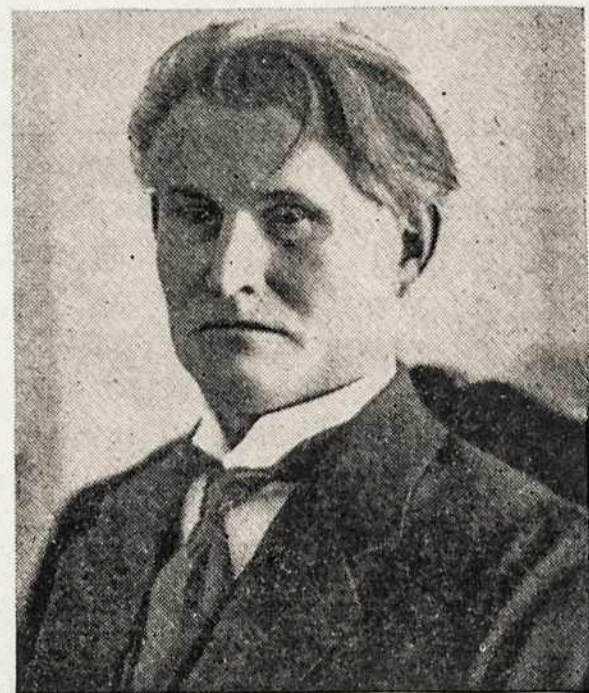
Dr. K. Grinius, third president of Lithuania.