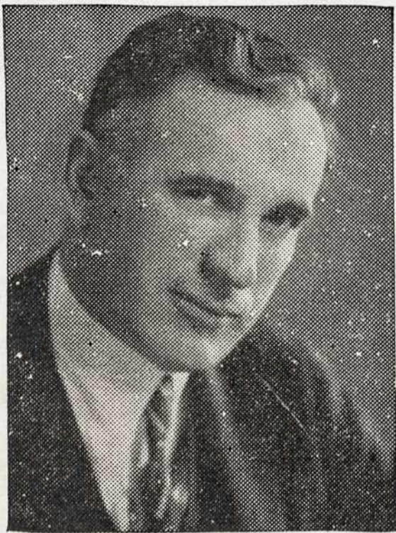
Congressman McCormack from Massachusetts addressed the House of Representatives on the 30th anniversary of Lithuania's Declaration of Independence.

of less than 3,000,000 people, is a Baltic State bounded on the north by Latvia, on the east and south by unhappy Poland and East Prussia, and on the west by East Prussia and the Baltic Sea.