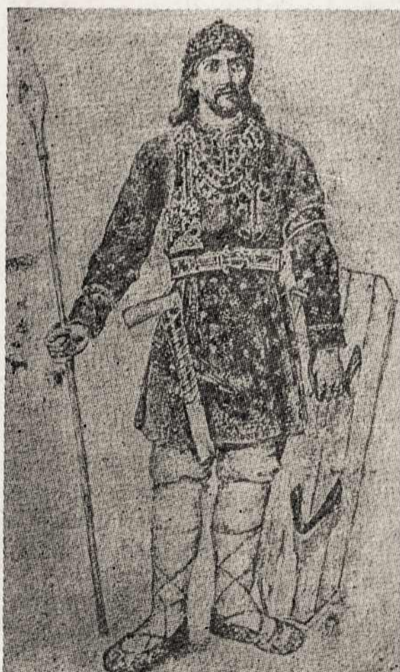
X-XI Century Lithuanian Warrior.