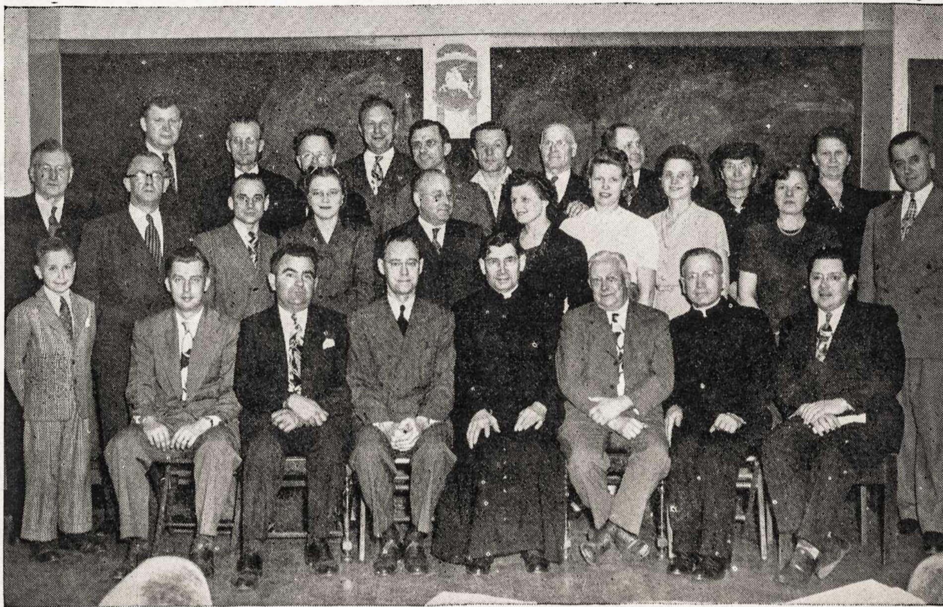
A.L.R.K.S.A. 56-TO SEIMO RENGIMO KOMISIJA