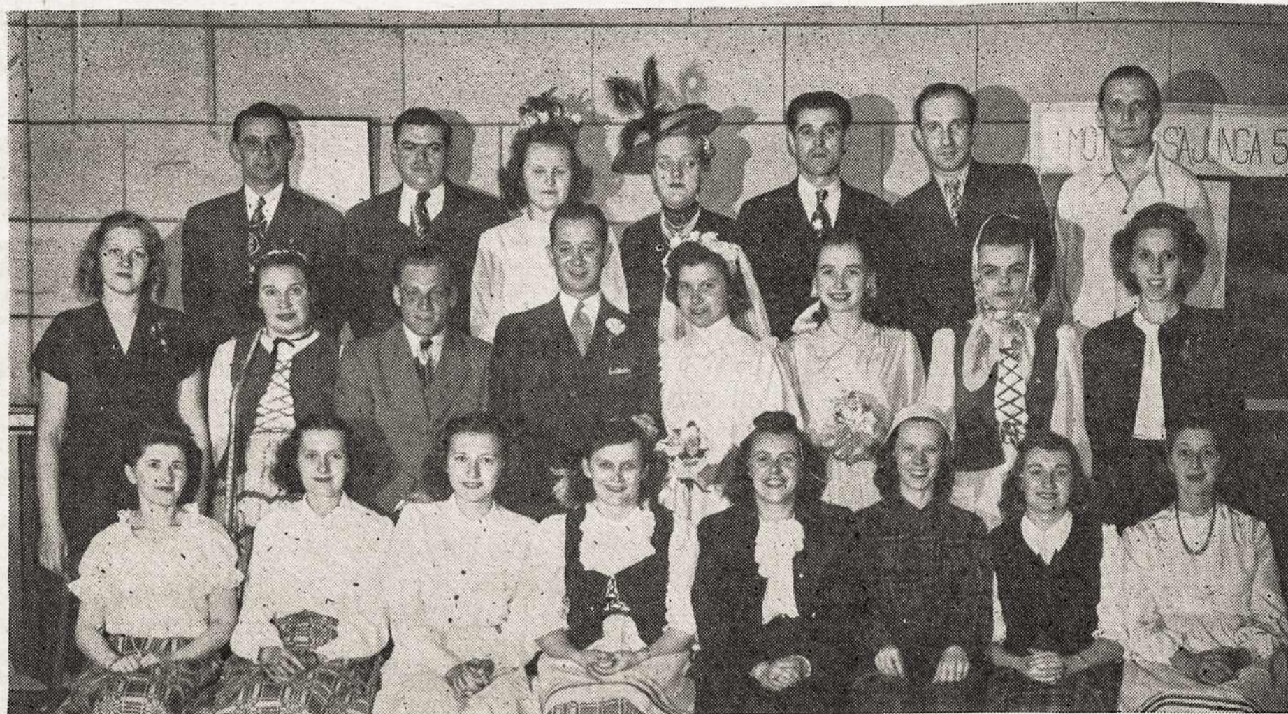
TRAVELING DRAMATIC GROUP, C-26, Worcester, Mass.