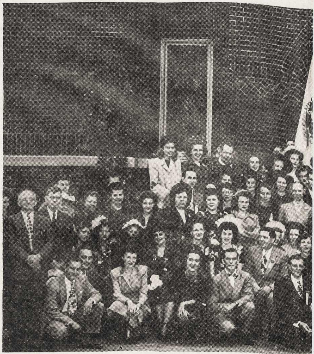
Lietuvos Vyčių 35-to Seir