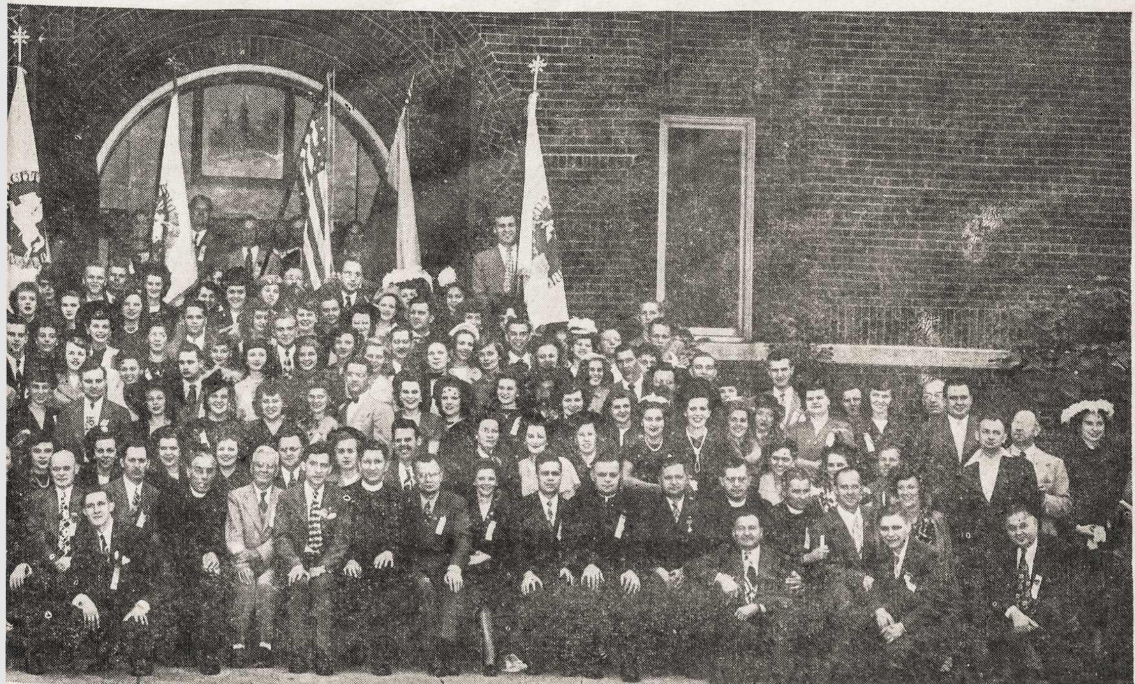
mo, Detroit, Michigan, delegatai, kuris įvyko rugsėjo 10-12 d., 1948 m.

vai ir lietuvybei. Už tai jai priklauso Lietuvos ir lietuvių padėka bei pagarba.