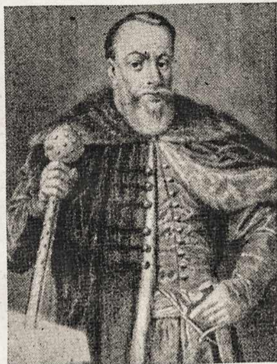
Katkus, arba Chodkevičius - Boreika, vienas iš žymiausių karo vadų lietuvių. Mirė 1621 m.

reigomis, Centro Valdyba, apie mėnuo atgal, suformulavo smulkmeniškai visą raštinės tvarkymą. Be to, po kelių mėnesių tyrinėjimo Centro Valdyba nutarė užvesti naują, modernišką rekordų laikymo sistemą ir tam tikslui jau nupirko tris plienines šėpas. Nors šis dalykas kainuoja nemažai pinigų, numatoma, kad įvedus geresnę tvarką, visos kuopos bus labiau patenkintos ir "Vyties" siuntinėjimas bus padėtas ant geresnių biznio pamatų. Užsilikusiems su mokesčiu "Vytis" dabar bus greit sulaikytas. Užvedus punktualumą Centre, turėsime teisės tikėtis punktualumo iš kuopų.