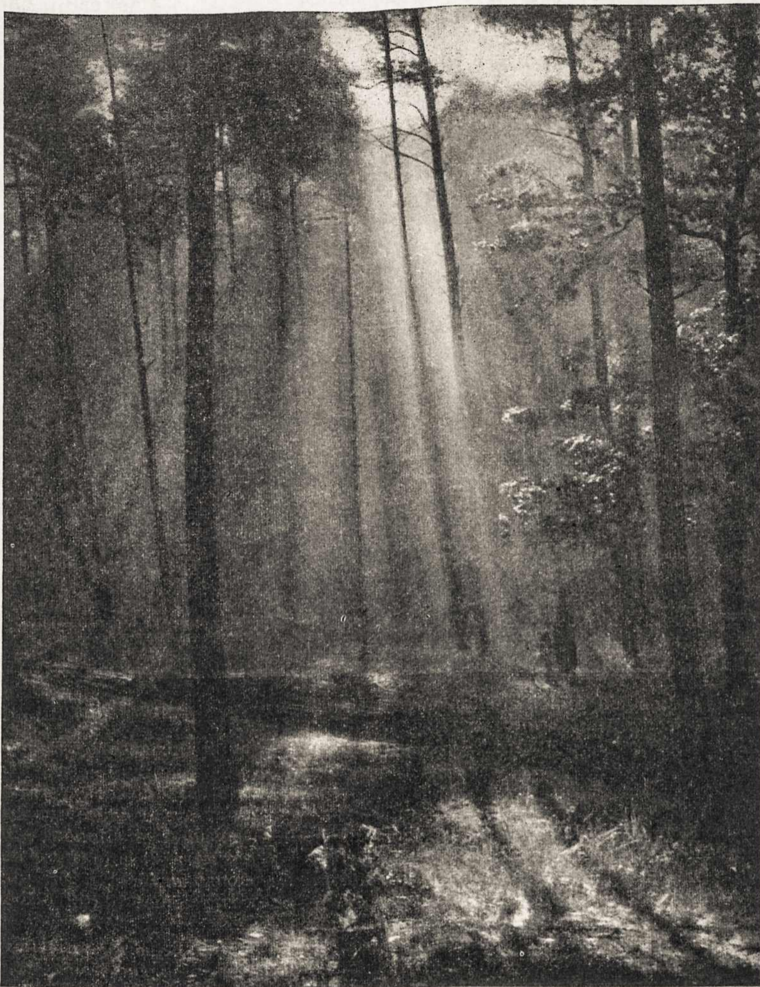
Miško romantika Lietuvoje