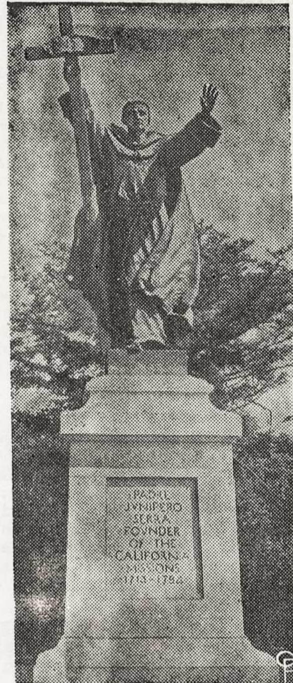
Fresno, Kalifornijoje, pastatytas paminklas atminčiai Padre Junipero Serra, kuris vienas iš pirmųjų misijonierių skelbęs tikėjimą tame krašte. Yra daromi žygiai, kad jis būtų paskelbtas šventuoju.