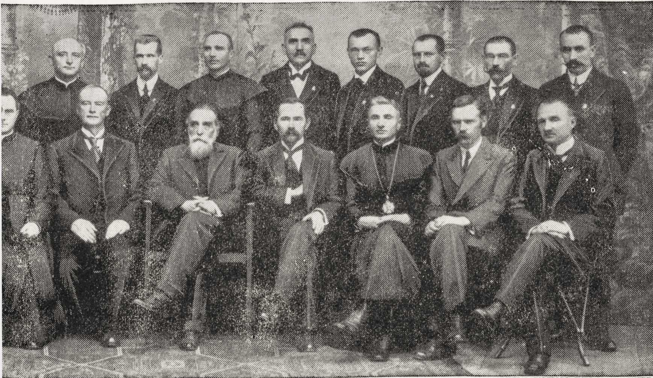
...ji Lietuvos Nepriklausomybės Paskelbimo Akta, Vasario 16 d., 1918 m.

Todėl per šimtą su viršum metų, net uolūs ir kruopštūs "reizu" Lietuvon registratoriai, kaip antai Meroldas Wiegandas Marburgietis (Prūsijoje), ar magistro kapelionas Hermanas de Wartberge tepaduoda labai atsitiktinių žinučių apie šventus kalnus, šventus miškus, šventas upes, šventus laukus, žodžiu, konkrečiai teįvardina tik tai, ką Dusburgas pirmasis bendrais žodžiais minėjo apie lietuvių gimines prūsus.