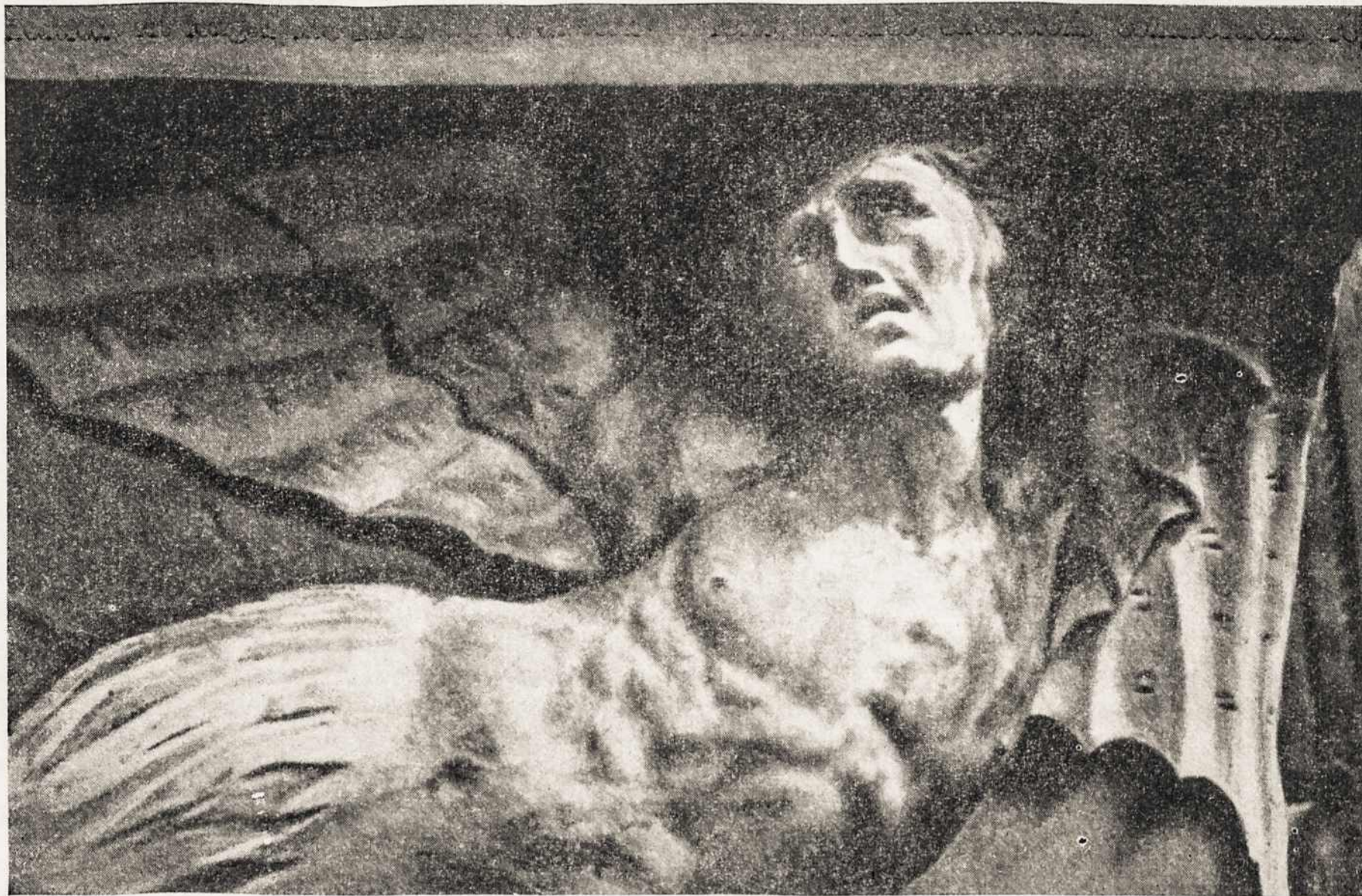
Šv. Petro ir Povilo bažnyčia Vilniuje. Demonas.

Lublin in 1569 was but the signal of gradual subjugation. The marriage was a union of bodies, but not of spirits. This was to be a house divided against itself. Authority started to diminish; false liberty, to assert itself. Disorder, distrust, disbelief reigned. Mother Lithuania stood exposed to public gaze and avarice. Her spirit weakened, she found herself in no state of bodily vigor to withstand the persistent pressure of the Muscovite and Swedish invasions. By successive stages she was stumbling, halting, dropping her weary arms in a defenseless gesture. She was in a position now to receive the reward and the penalty of embracing Christ as the Spouse of her soul. Lithuania, Mother Lithuania was up before the world court for judgment. She was being sentenced after the manner of her Divine Consort — to the WAY OF THE CROSS!