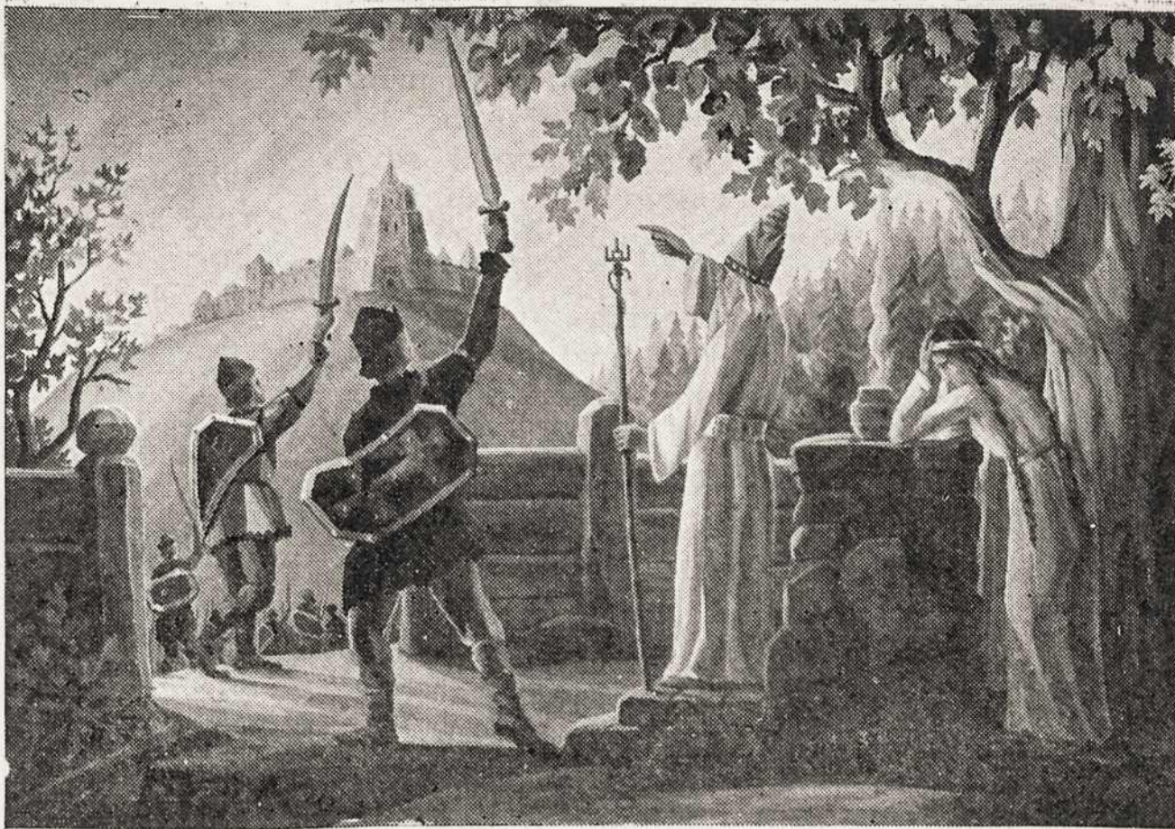
“Šv. Pranciškaus Varpelio” klišė.