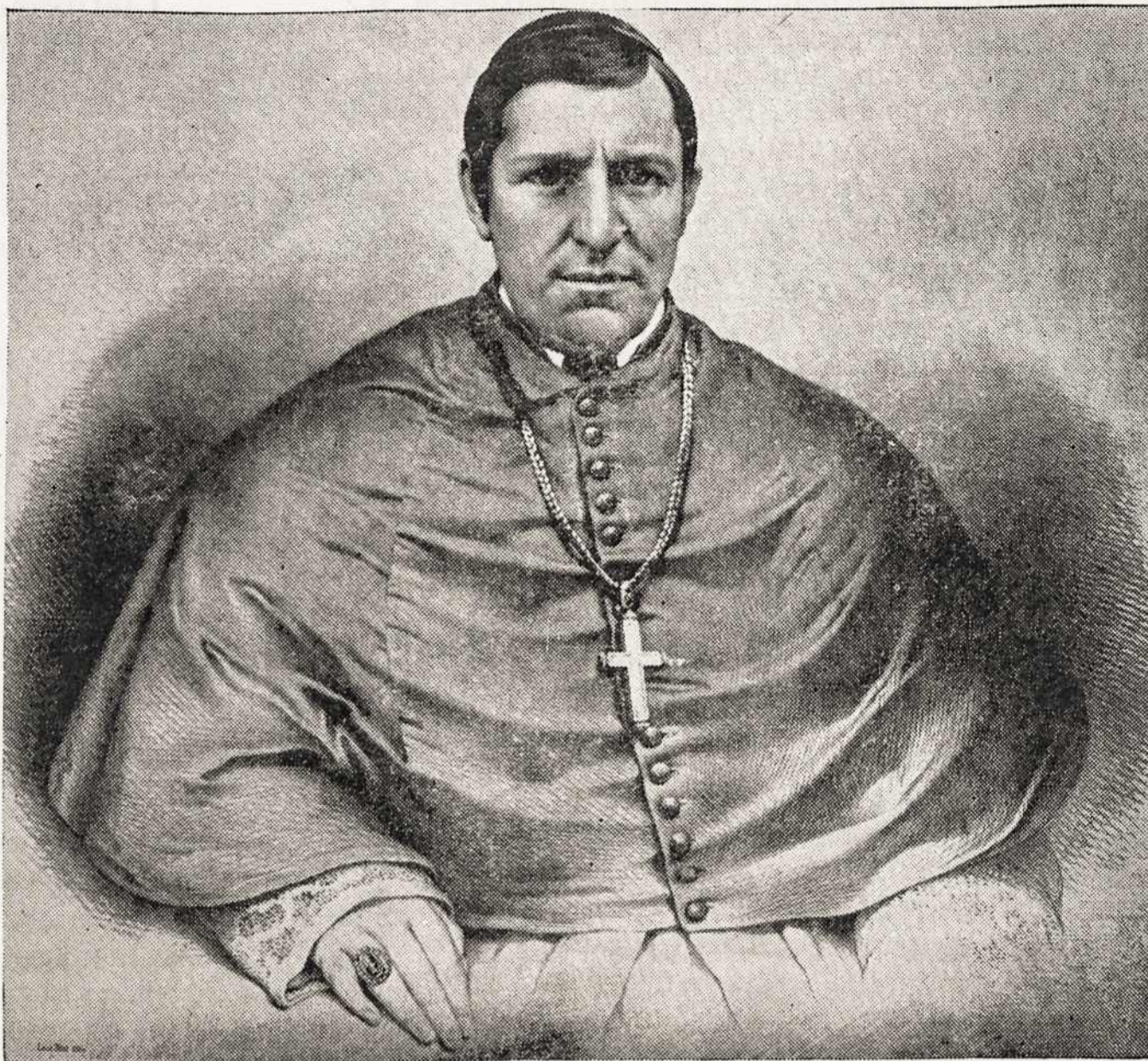
"Šv. Pranciškaus Varpelio" klišė.

Yra sakoma: išmintingesnis miesto veršelis, nekaip sodžiaus vaikelis; tačiau atsiranda kartais ir sodžiuose mažiukų su apvalia galva.