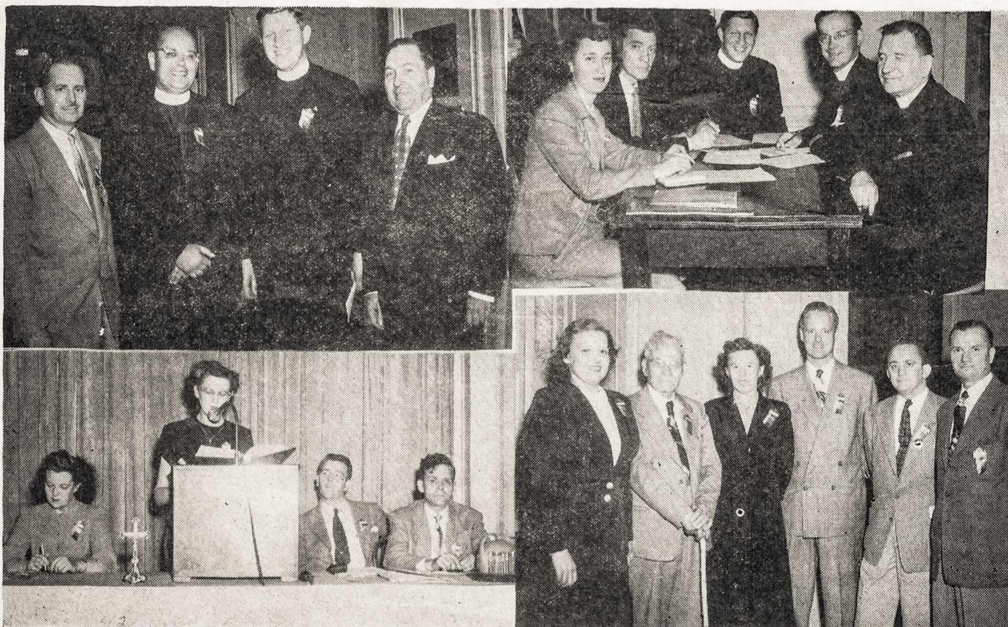
37th NATIONAL CONVENTION COMMITTEES — CHICAGO, ILL.