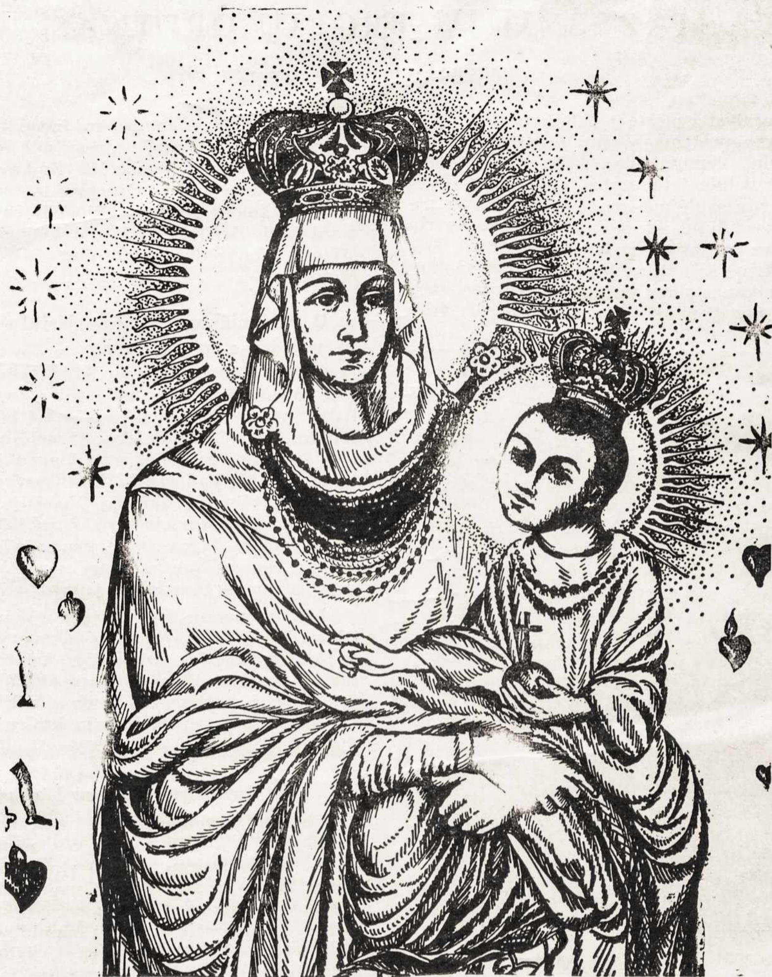
Stebuklingas Dievo Motinos paveikslas šiluvoje

Koplyčios viduje yra įrengtas altorius. Jis stovi atokiai nuo sienos. Pačiame koplyčios viduryje ant akmens stovi Švenčiausios Panelės su Kūdikiu statula. Ji kaip tik ir atvaizduoja tą momentą, kada apsireiškė. Kalbama, kad po statula padėtas ir pats akmuo, ant kurio Ji pasirodė.