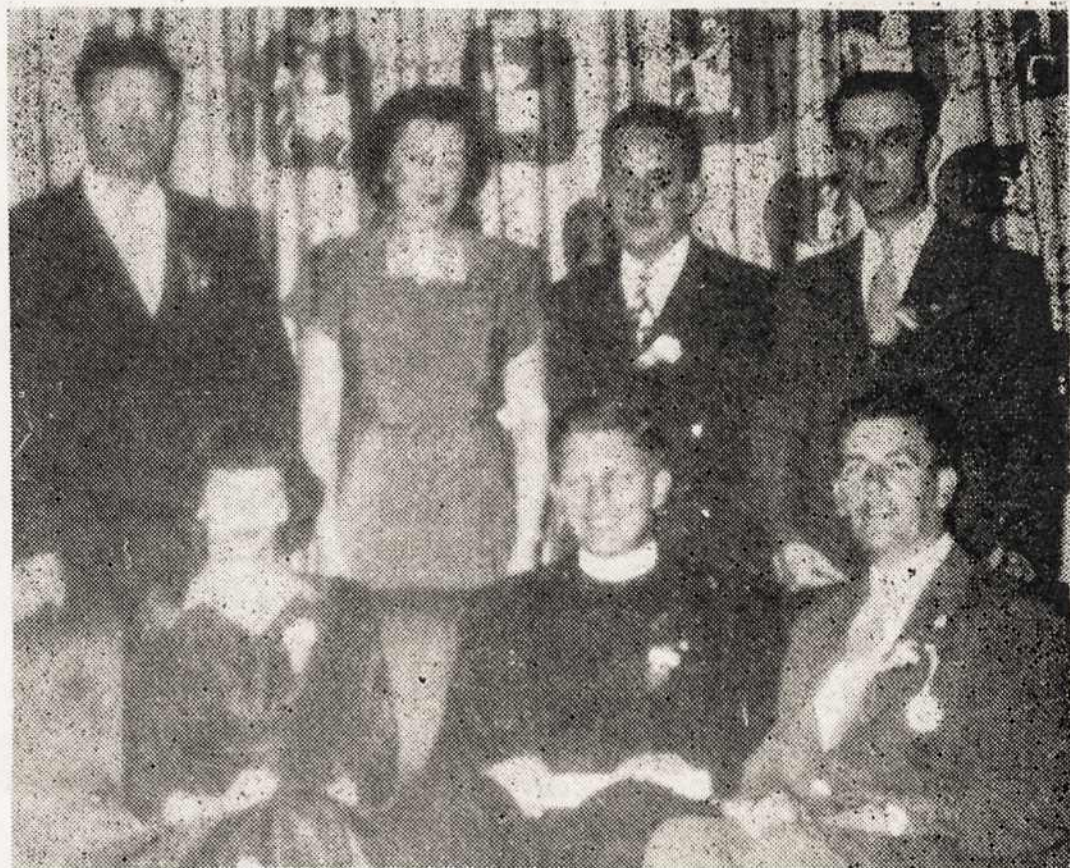
NATIONAL OFFICERS ELECTED BY YOUR DELEGATES AT THE CONVENTION

Šiais metais tikrai padaryta didelė pažanga, nes pirmą kartą po daug metų nepraradome nė vienos kuopos. Dar daugiau — sustiprinom visas svyruojančias kuopas, taip kad dabar organizuoja