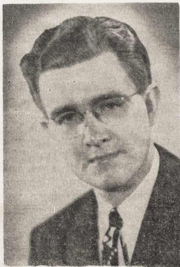
Ernest E. Johns Studio

Kiekvienai kuopai privaloma turėti Lietuvių Reikalų veikiančias komisijas. Dabar yra 30 kuopų, kurios aktyviai veikia tautiniame darbe. Šios